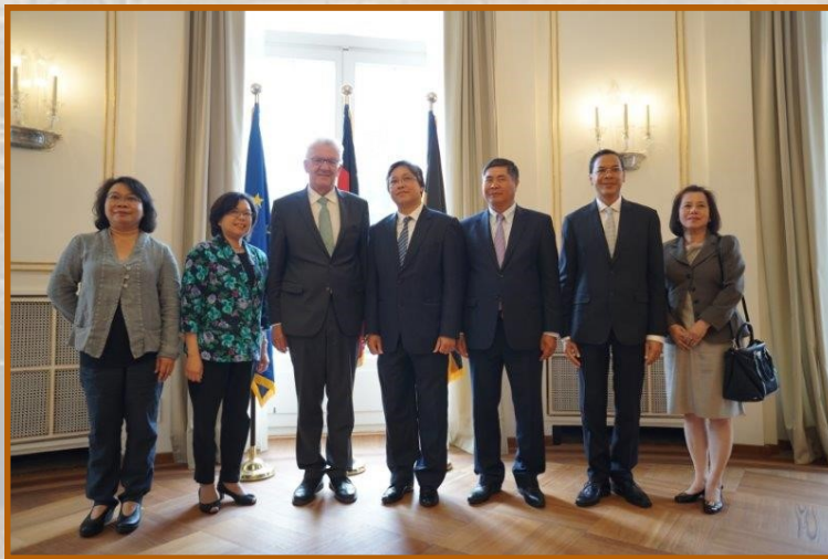
Kiri: Wakil-wakil BAC bergambar bersama Ketua Menteri En. Winfried Kretschmann.

Bagi mengakhiri lawatan kerja tersebut, delegasi BAC mengadakan satu pertemuan dengan Dr. Nicole Hoffmeister-Kraut, Menteri Hal Ehwal Ekonomi, Buruh dan Perumahan Baden-Württemberg pada 14 Julai 2016. Wakil-wakil agensi tempatan di Baden-Württemberg turut hadir di pertemuan tersebut untuk berkongsi maklumat mengenai potensi Baden-Württemberg sebagai lokasi perniagaan dan pelaburan.