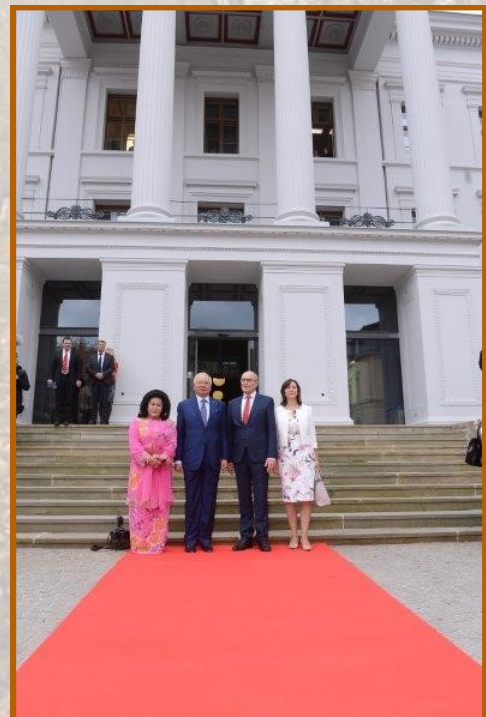
Kanan: Perdana Menteri dan isteri bergambar dengan pasangan pertama Mecklenburg-Vorpommern di hadapan pejabat kanselari Negeri.