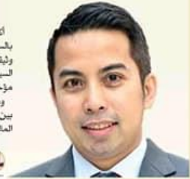
حاور - إبراهيم بلدي

أكد السيد محمد شاهر سفير الدين لقائم بالأعمال بالسفارة الماليزية بدولة قطر، أن العلاقات بين قطر وماليزيا وثيقة وأخوية، وتستمر في مسارها التصاعدي مع تولي دولة السيد محيي الدين ياسين رئيس وزراء ماليزيا الجديد لمنصبه مؤخرًا. وقال في حوار عن بُعد مع الرأية إن الزيارات المتبادلة بين قادة البلدين شكلت قوة دفع جديدة للعلاقات القطرية الماليزية فيما أتاحت فرصا مهمة للاستفادة بشكل أفضل