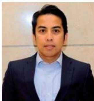
Mohamad Shahir Sabarudin, Charge d'Affaires at the Embassy of Malaysia in Qatar

"This year in view of the pandemic, Muslims will have to be doing their part to stem the spread of COVID-19," he added. To mitigate the spread of COVID-19, Qatar has implemented physical distancing measures aimed at interrupting transmission, closed non-essential businesses, reduced the number