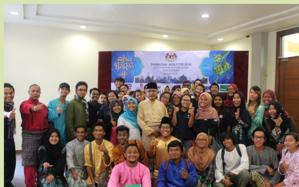
TYT Duta Besar bersama sukarelawan MyCorps

MAJLIS SAMBUTAN HARI RAYA AIDILFITRI 2016 INI TELAH BERJAYA DIANJURKAN OLEH KEDUTAAN BESAR MALAYSIA PHNOM PENH DENGAN KERJASAMA CAMBODIA ASIA BANK, CAMPU BANK, CIMB, HONG LEONG BANK, MAYBANK, RHB INDOCHINE SERTA SYARIKAT SMART AXIATA .