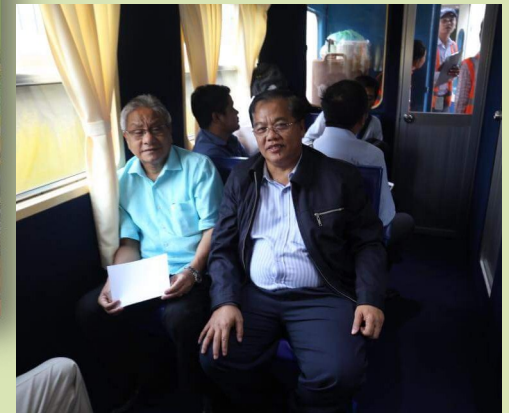
Inaugural train ride to Sihanoukville. TYT was the only Ambassador invited for the 7 hours journey with PM Hun Sen. With him is H.E Othman Hassan, Minister in the Prime Minister's Department of Cambodia