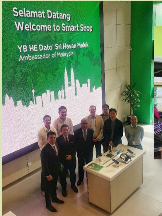
TYT Ambassador's visit to SMART Axiata