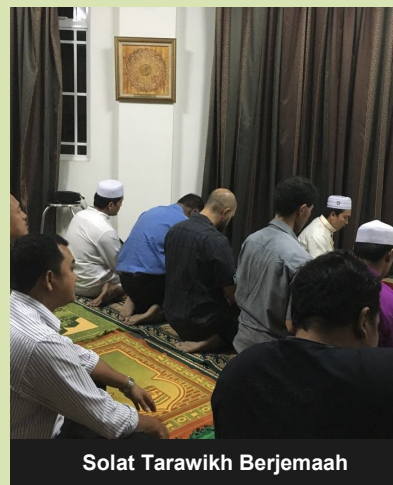
Solat Tarawikh Berjemaah

Solat Tarawikh yang diimamkan oleh Ustaz-ustaz tempatan biasanya akan diakhiri dengan sesi "Moreh" yang disediakan oleh Perwakilan.