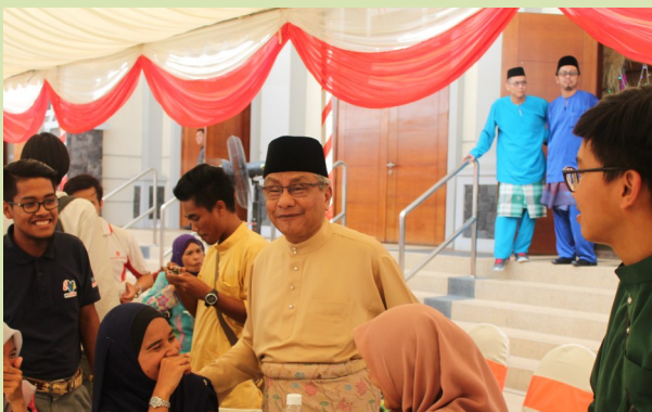
TYT Duta Besar beramah mesra bersama tetamu yang hadir