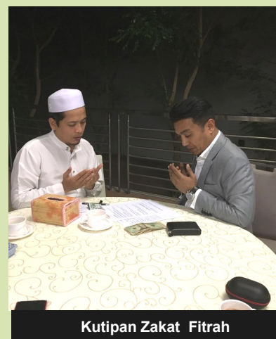
Kutipan Zakat Fitrah