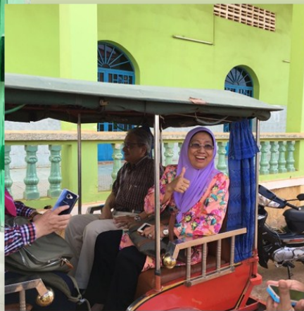
Visit by Dato' Sri Ambassador and Datin Sri to Kampong Khleang Sbek