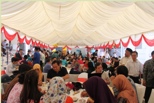
500 tetamu telah hadir memeriahkan Sambutan Aidilfitri 2016