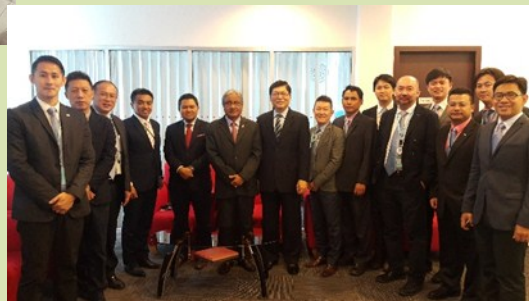
TYT Ambassador's visit to RHB Indochine