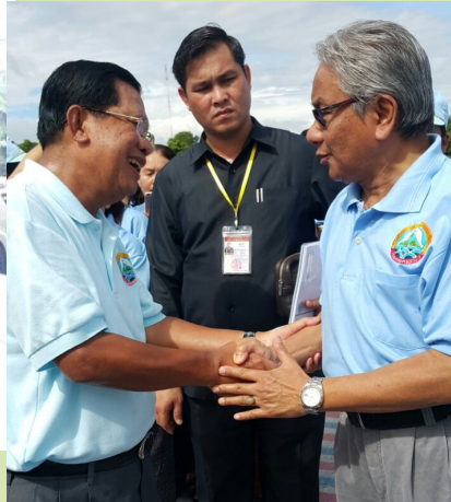
With Prime Minister Hun Sen during National Fish Day in Kampong Speu Province