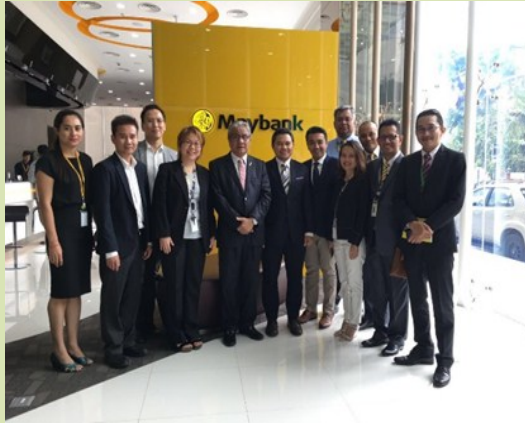
TYT Ambassador's visit to Maybank Cambodia

There is never a dull moment at Malawakil Phnom Penh, there is always something to do and someone to meet. A slow day is practically non-existence. Allow us to share a little bit of our day to day activities for the past four months.