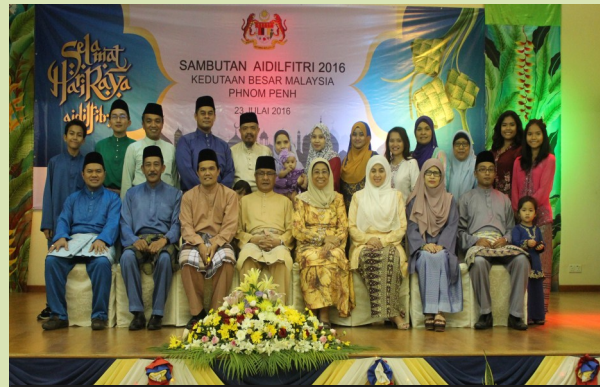
Keluarga Besar Malawakil Phnom Penh