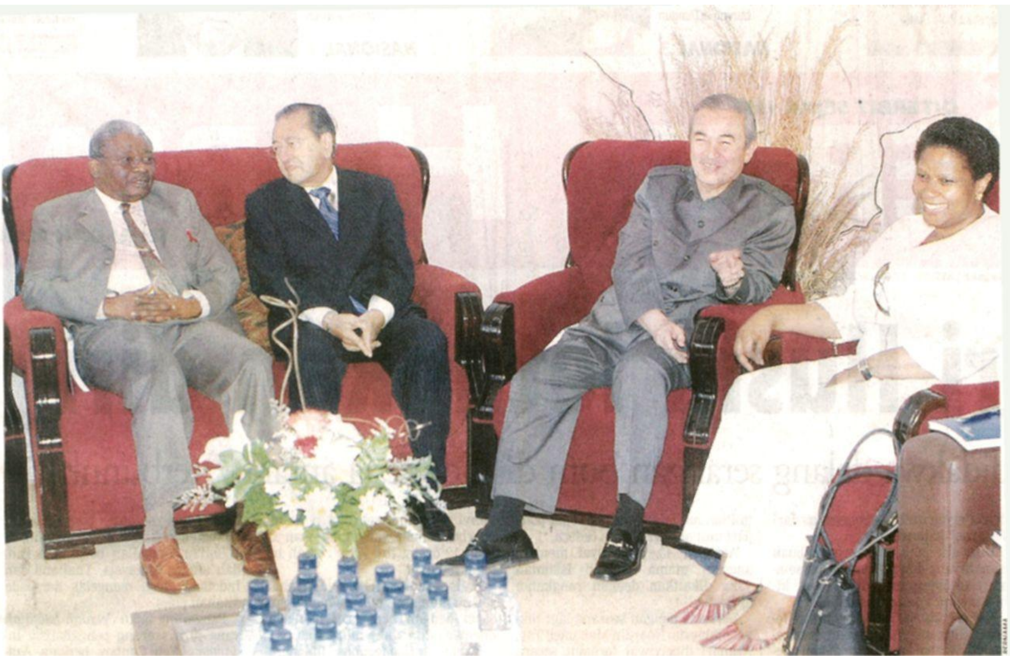
MESRA: Abdullah bersama bekas Perdana Menteri, Tun Dr Mahathir Mohamad berbincang dengan pemimpin negara peserta pada majlis jamuan sempena Dialog Global Antarabangsa Selatan Afrika 2005 di Maseru, semalam.

Dialog Global Antarabangsa Selatan Afrika 2005 (SAID-2005)