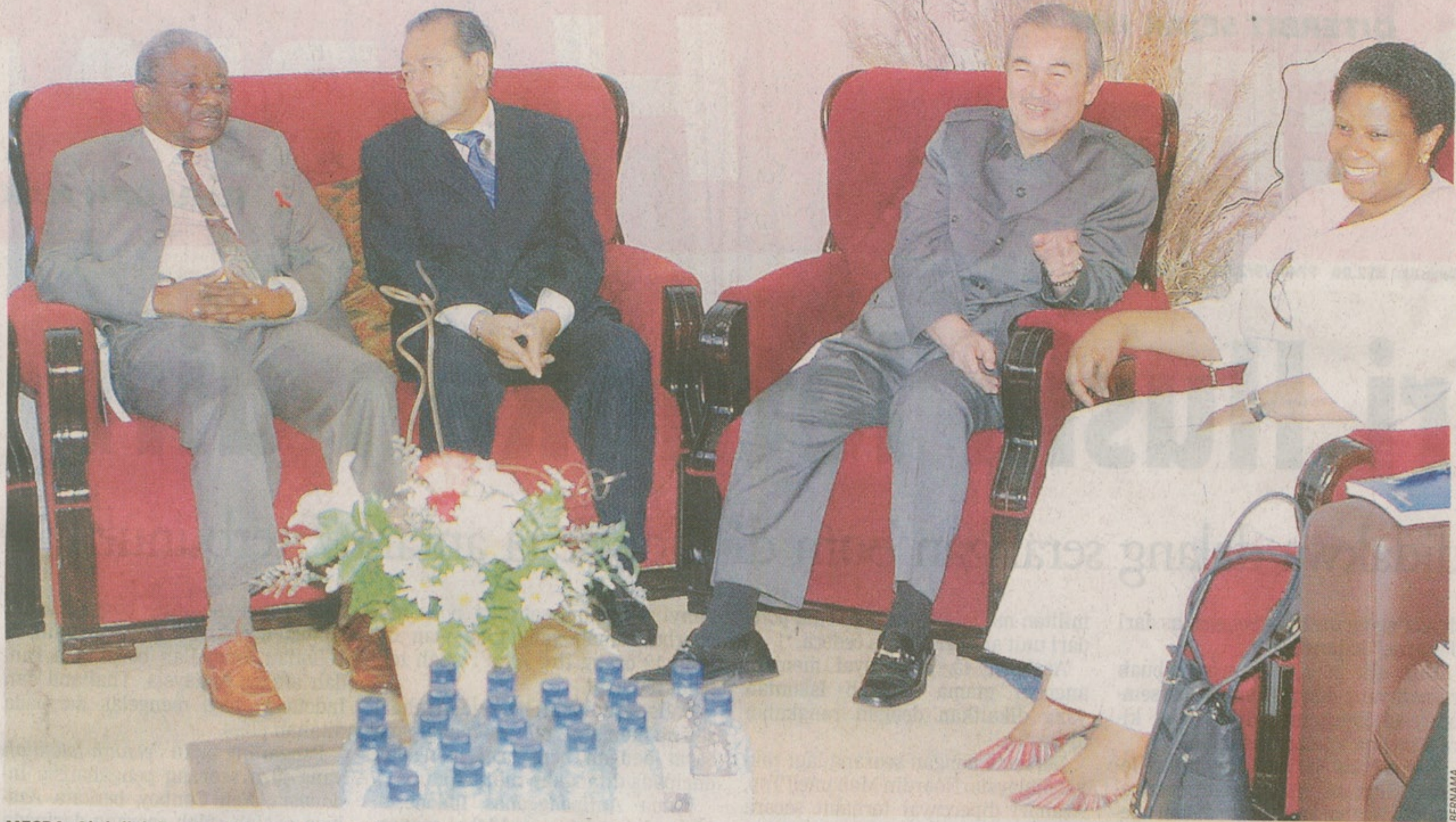
MESRA: Abdullah bersama bekas Perdana Menteri, Tun Dr Mahathir Mohamad berbincang dengan pemimpin negara peserta pada majlis jamuan sempena Dialog Global Antarabangsa Selatan Afrika 2005 di Maseru, semalam.

Dialog Global Antarabangsa Selatan Afrika 2005 (SAID-2005)