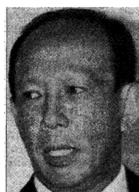
Tun Musa Hitam