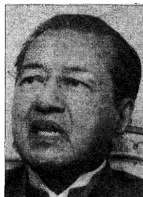
Tun Dr. Mahathir Mohamad