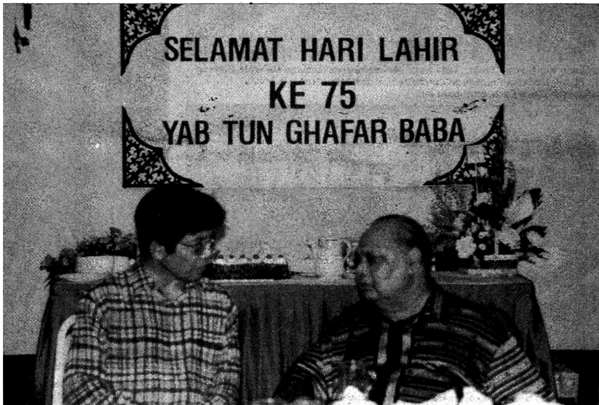
Penulis bersama Allahyarham Tun Ghafar Baba ketika menyambut hari lahirnya yang ke 75 pada tahun 2000 yang dianjurkan oleh parti MCA di pejabat Tun Ghafar di Kuala Lumpur.

beberapa portfolio penting dan hanya meninggalkan Kerajaan di bawah kepimpinan, Datuk Seri Dr. Mahathir Mohamad (Tun) setelah beliau menarik diri dari mempertahankan jawatannya sebagai Timbalan Presiden UMNO apabila banyak bahagian-bahagian di seluruh negara memberi sokongan padu kepada Anwar Ibrahim.