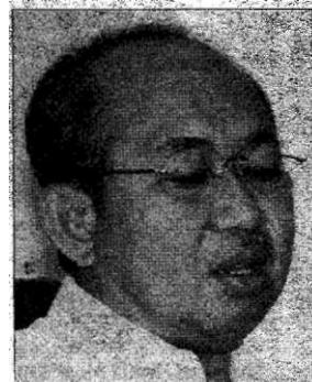
Tengku Razaleigh Hamzah