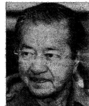
Tun Dr. Mahathir Mohamad