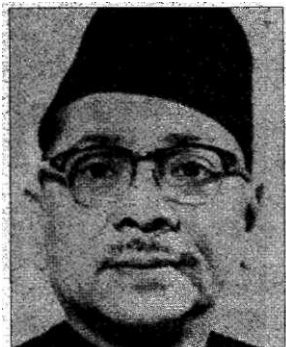
Allahyarham Tunku Abdul Rahman Putra Al-Haj