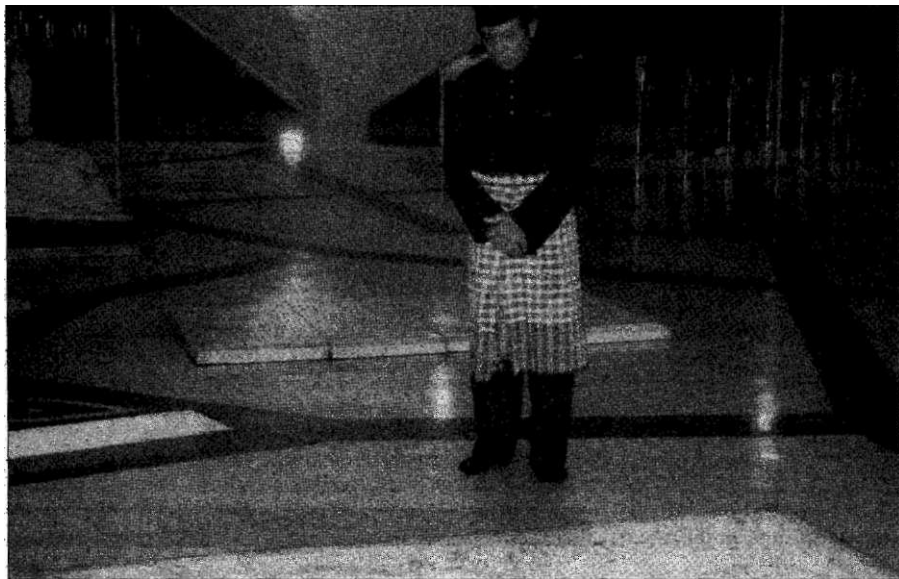
Penulis bertafakur di makam Tun Ghafar di Makam Pahlawan di Masjid Negara.

Perdana Menteri yang juga Timbalan Presiden UMNO itu yang tidak diketahui umum. Sebenarnya apabila Tun Ghafar Baba menarik diri dari bertanding sebagai Timbalan Presiden "UMNO dan semua jawatan dalam Kerajaan dan Parti beliau teras dipinggirkan seolah-olah semua jasa bakti dan pengorbanan serta sumbangan beliau di lupakan dengan sekelip mata.