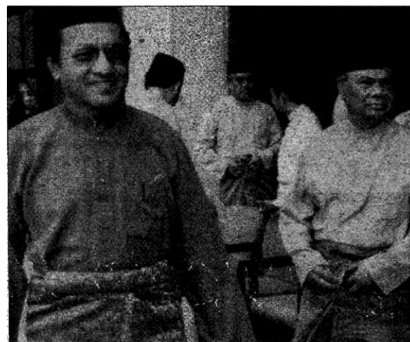
دكتور محضر محمد دان ا. غفار باب سبائك تيبا دفكا راقن فوسه دا كفن دنيا فتر في دهبوتق. سي. با. كوالا لهور كلارين انتوق مفاخيري فرصيتون كاكورغ ايبو. عا. ١٠٠٠