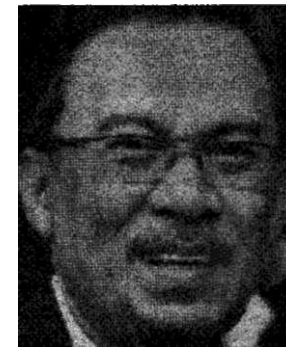
Datuk Seri Anwar Ibrahim