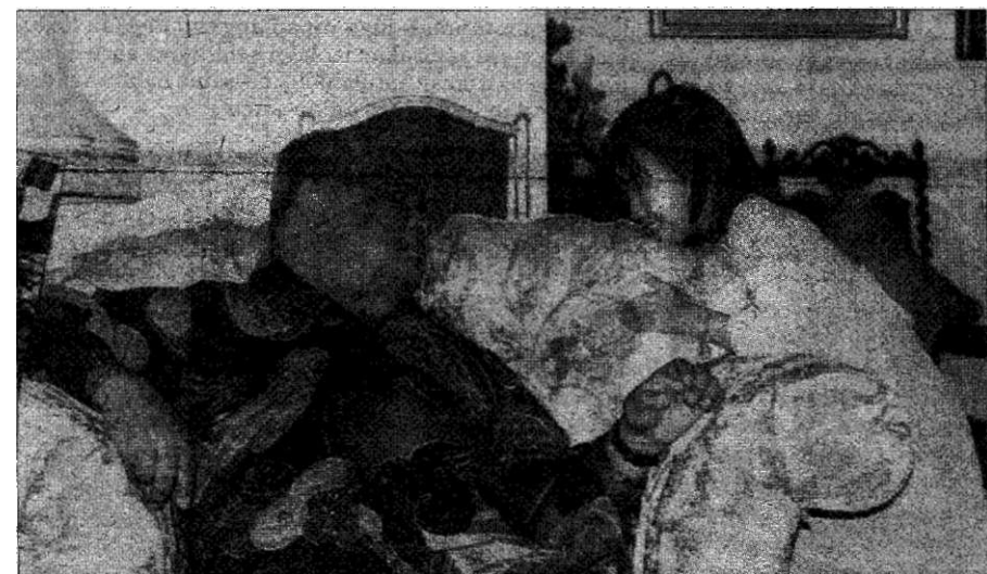
Tun Ghafar begitu mesra dengan kanak-kanak - Tun Ghafar sedang bertanya sesuatu kepada cucuanda penulis, Farah Natasha, apabila mengunjungi rumah terbuka penulis pada bulan Februari 2003. Ketika itu Tun Ghafar sihat.

KETIKA UMNO menghadapi masalah dalaman dan orang Melayu berpecah, saya terpaksa memberanikan diri untuk menemui Encik Ghafar Baba untuk membincangkan beberapa perkara penting yang harus diatasi dengan seberapa segera supaya keadaan yang membimbangkan itu tidak berlarutan dan perpaduan orang Melayu terugat terus.