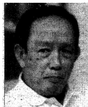
Tun Musa Hitam