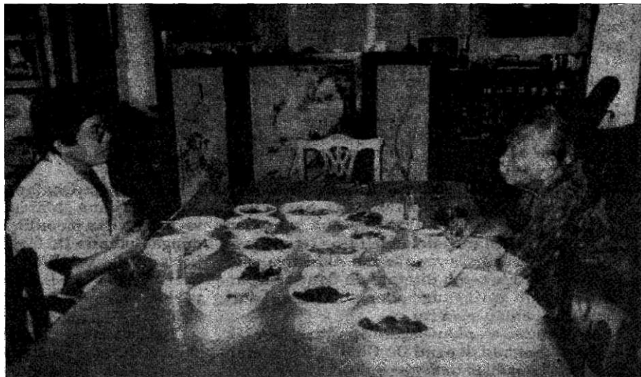
Gambar penulis bersama Tunku ketika Tunku menjamu penulis dengan makan tengah hari di kediamannya di Pulau Pinang. Gambar ini dirakamkan pada 20 Mac, 1987. Dalam perbincangan empat mata di antara penulis dengan Tunku ekoran dari pergolakan politik tanahair ketika itu, Tunku berhasrat mencadangkan kepada Dr. Mahathir supaya Ghafar Baba dilantik sebagai Gabenor Melaka atau Pulau Pinang manakala Musa Hitam di hantar ke PBB New York sebagai wakil Malaysia ke Badan Dunia Itu. Tentang Tengku Razaleigh pula, beliau mencadangkan supaya Tengku Razaleigh dilantik sebagai Timbalan Perdana Menteri bagi mengatasi kemelut yang berlaku dalam UMNO ketika itu..

Surat penulis kepada Encik Ghafar Baba (Tun) bertarikh 9 Mei 1986 mengucapkan tahniah atas perantukan beliau sebagai Timbalan Perdana Menteri serta kebimbangan penulis tentang dasar Kerajaan ketika itu untuk mencapai 30 peratus ekuiti bumiputera dalam semua bidang.