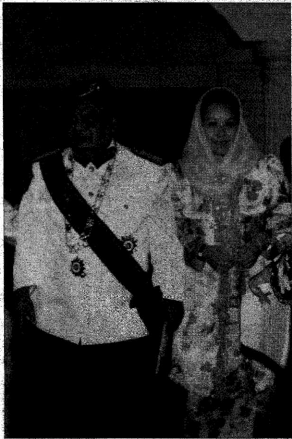
Tun Ghafar tiba di Istana Negara bersama isteri keduanya, Heryati Abdul Rahim untuk menghadiri Hari Keputeraan Sen Paduka Baginda Yang Di Pertuan Agong beberapa tahun lalu.