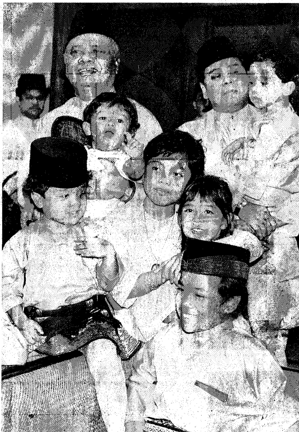
SENTIASA DI INGATAN: Tun Ghafar bergambar bersama cucunya ketika rumah terbuka Aidilfitri di Pusat Dagangan Dunia Putra (PWTC) pada 1987.

Pada 1969, beliau dilantik Menteri Pembangunan Luar Bandar sebelum bertukar ke Kementerian Pertanian dan Pembangunan Luar Ban-