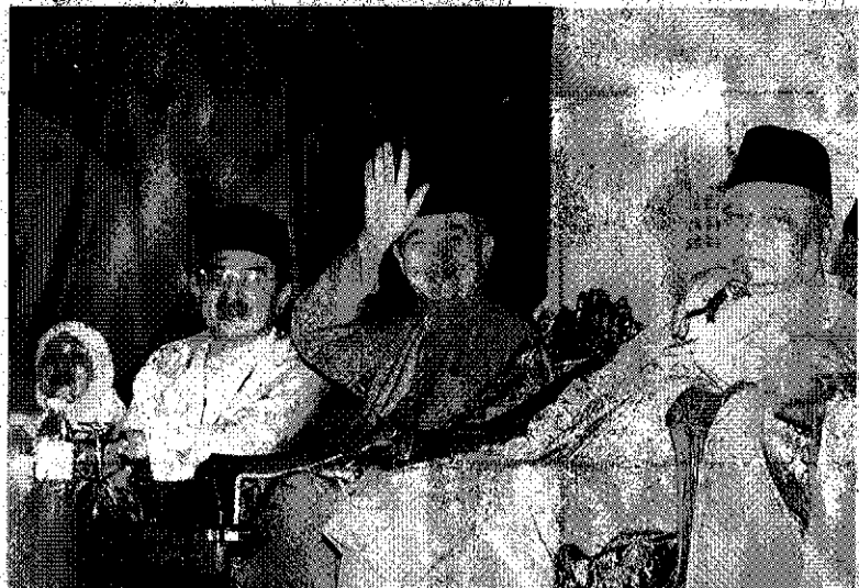
DALAM KENANGAN: Tun Ghafar bersama Perdana Menteri, Datuk Seri Abdullah Ahmad Badawi dan Ketua Menteri Melaka, Datuk Seri Mohd Ali Rustam.