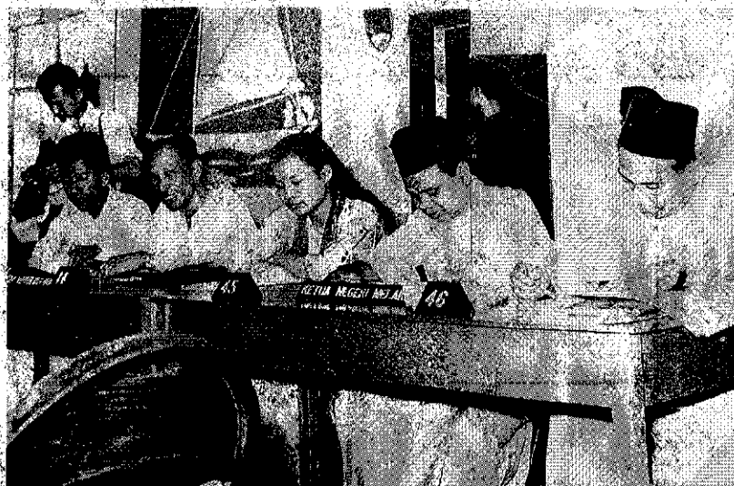
TINGGAL KENANGAN: Tun Ghafar ketika menghadiri Mesyuarat Agung Umno Malaya di rumah Umno Jalan Tunku Abdul Rahman, Kuala Lumpur pada 1958.