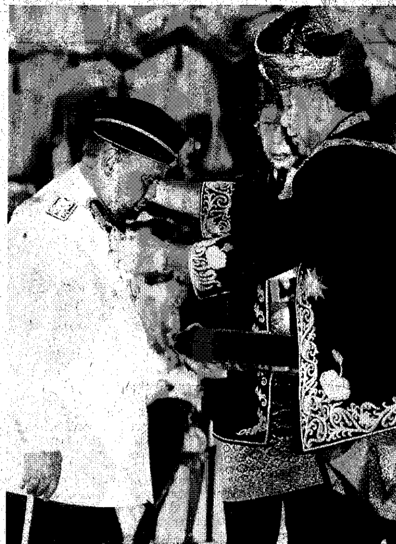
JASAMU DIKENANG: Tun Ghafar menerima anugerah Seri Setia Mahkota yang membawa gelaran Tun daripada Yang di-Pertuan Agong ke-10 pada 1995.