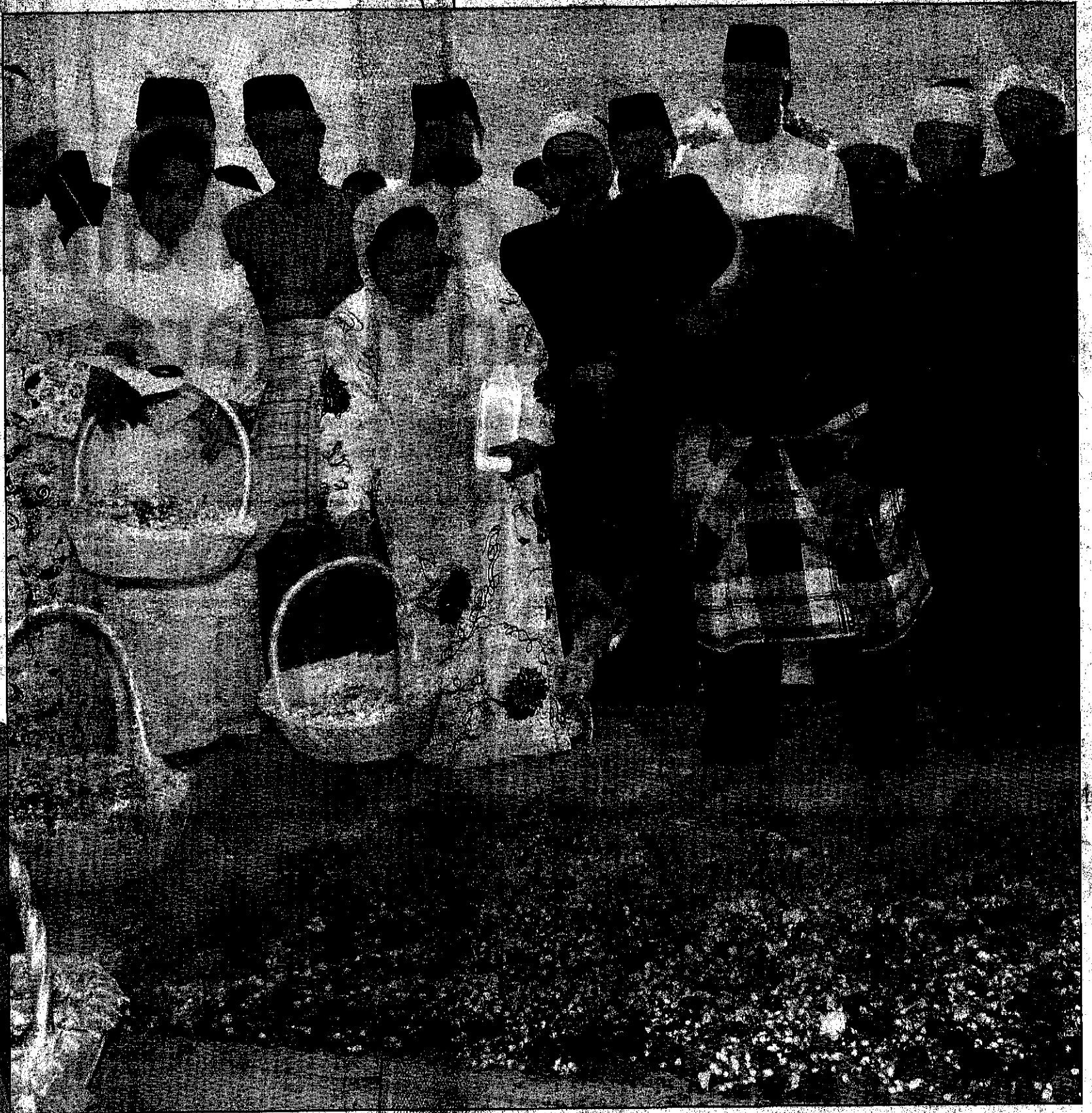
ALLAHYARHAM TUN GHAFAR BABA