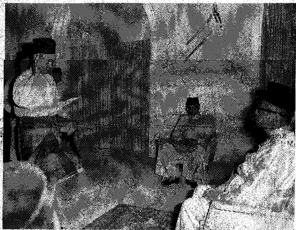
GHAJAR Baba mengangkat sumpah jawatan Menteri Pembangunan Negara dan Luar Bandar pada 1969.