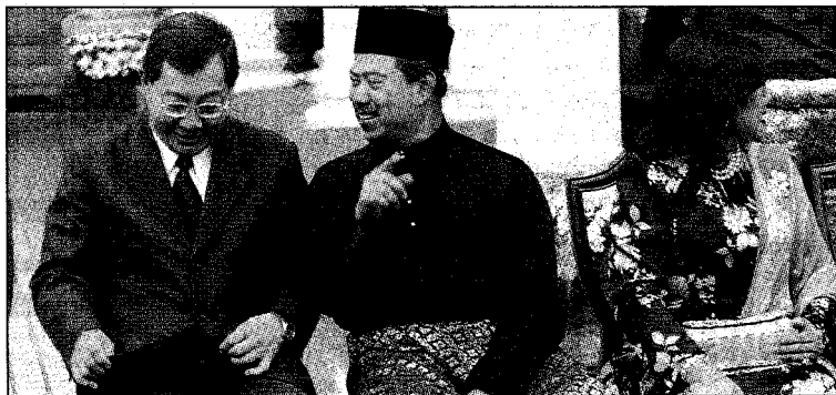
MUHYIDDIN (tengah) sempat berjenaka dengan Dr Fong Chan Onn ketika menteri dan timbalan menteri bersedia untuk bergambar bersama-sama Yang di-Pertuan Agong.