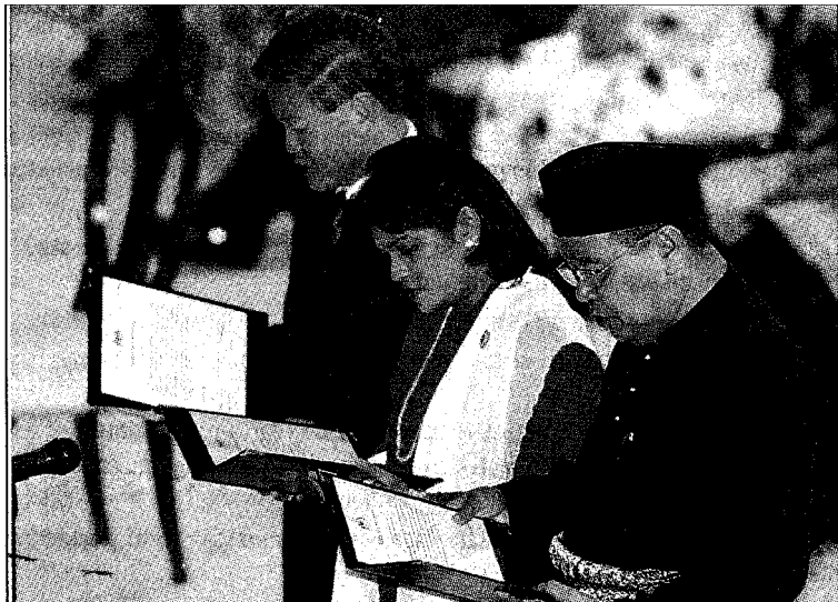
(DARI KIRI) Dr Chua Soi Lek, Azalina dan Dr Abdullah mengangkat sumpah jawatan, taat setia dan menyimpan rahsia di hadapan Yang di-Pertuan Agong di Balairong Seri, Istana Negara.