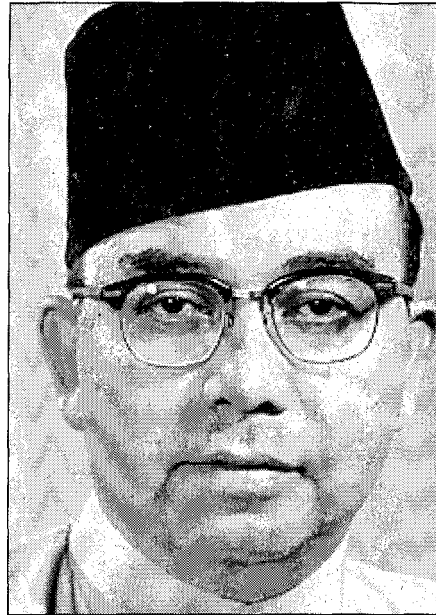
Allahyarham Tun Abdul Razak

Ada penyelidik berpendapat masalah orang Melayu ialah kita tidak berasa terancam. Survival instinct kita tidak menyerlah. Kita terlalu selesa manakala budaya perniagaan kita juga kurang baik sedangkan pesaing kita pula memiliki under siege syndrome yang menyebabkan mereka produktif