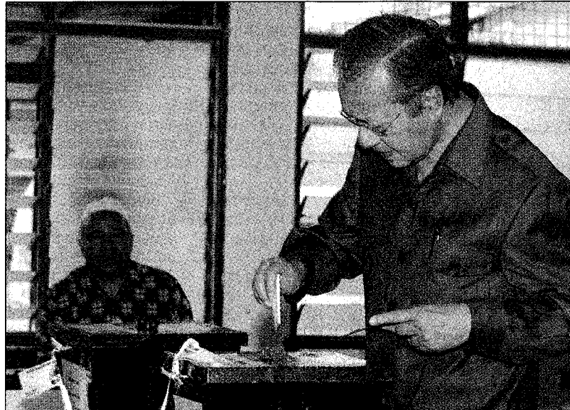
DR MAHATHIR mengundi di Sekolah Kebangsaan Titi Gajah, Alor Star, semalam.