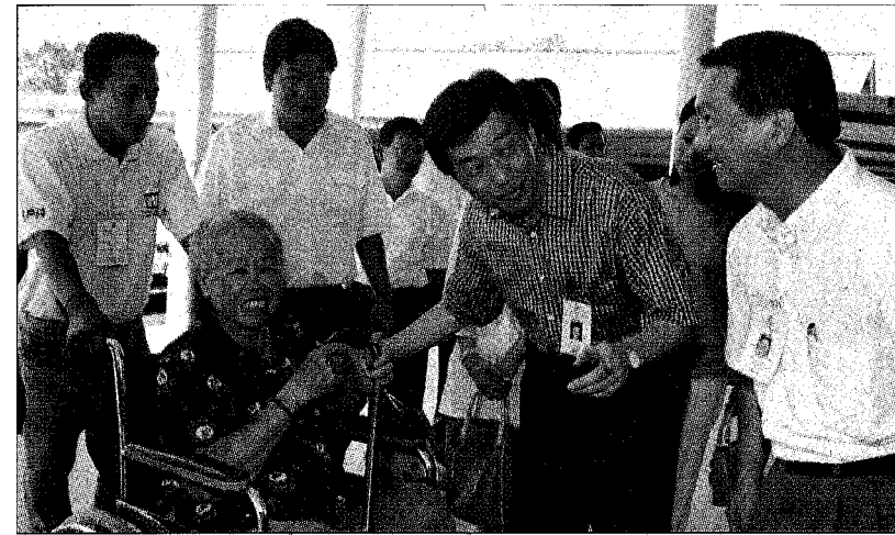
ONG KA TING beramah mesra dengan pengundi di Pekan Nenas, Johor.

Menteri Pembangunan Wanita dan Keluarga, Datuk Seri Shahrizat Abdul Jalil pula mengundi di Sekolah Menengah Kebangsaan (SMK) Bangsar,