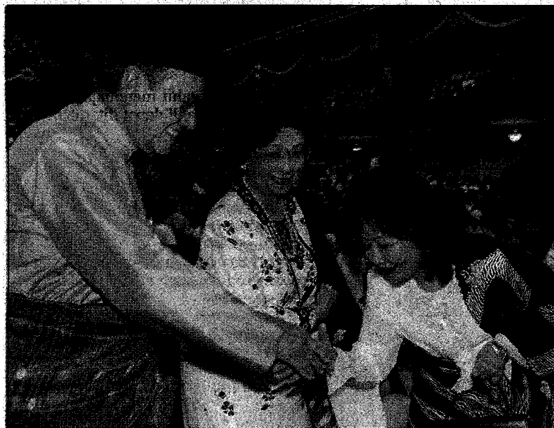
ISTERI Perdana Menteri, Datin Seri Endon Mahmood bersalaman dengan Dr Mahathir sambil diperhatikan Dr Siti Hasmah setibanya di Dewan Merdeka, semalam.