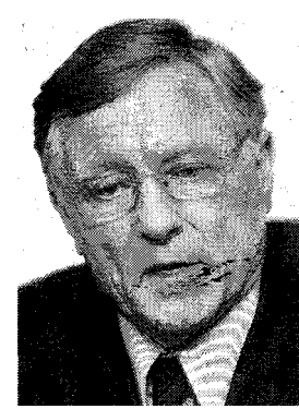
HANS VON SPONECK