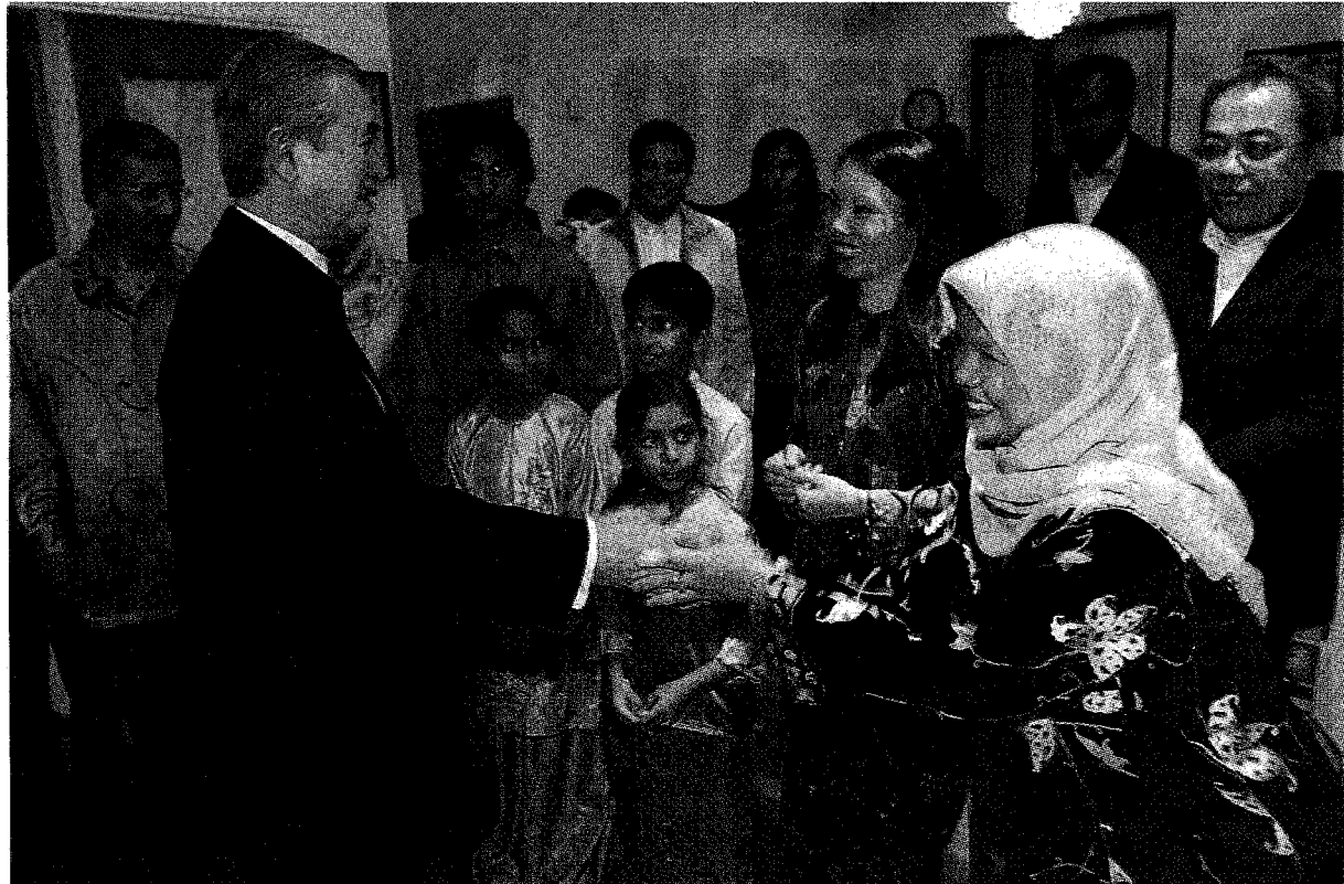
SELAMAT DATANG: Abdullah bersalaman dengan kakitangan dan keluarga kedutaan ketika menghadiri makan malam di Kedutaan Malaysia di Espoo, di Helsinki, semalam.

"Jadi selagi hakikat ini tidak diterima dengan baik, kita mungkin