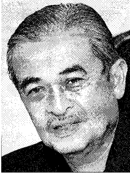
Abdullah Ahmad Badawi

Penjelajahannya berterusan pula ke Jepun dan China, dua daripada rakan dialog Asean yang masing-masing dianggap sebagai peluang dan cabaran. Lawatannya ke Korea Selatan yang dijangka bulan depan, bakal melengkapkan pusingan ke negara serantau.