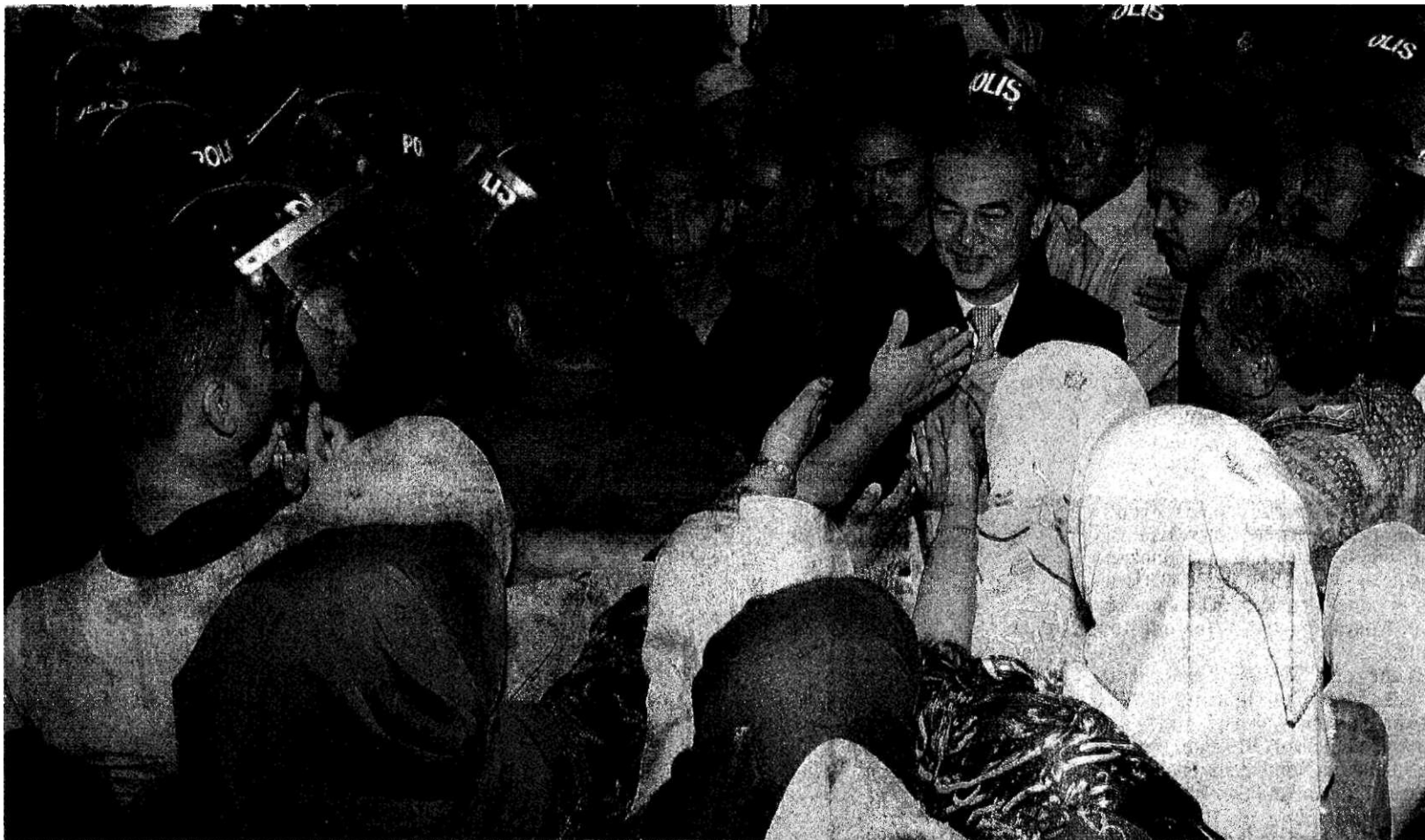
PEMIMPIN PRIHATIN: Abdullah bersalaman dengan orang ramai ketika menuju ke tempat letak kereta untuk berucap kepada 5,000 orang yang menyambut ketibaannya di Lapangan Terbang Antarabangsa Sultan Ismail, Senai, semalam.