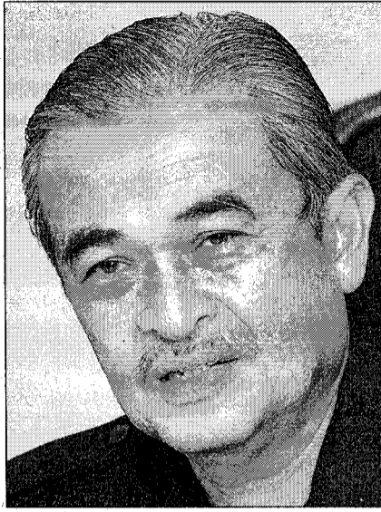
Abdullah Ahmad Badawi

Penjelajahannya berterusan pula ke Jepun dan China, dua daripada rakan dialog Asean yang masing-masing dianggap sebagai peluang dan cabaran. Lawatannya ke Korea Selatan yang dijangka bulan depan, bakal melengkapkan pusingan ke negara serantau.