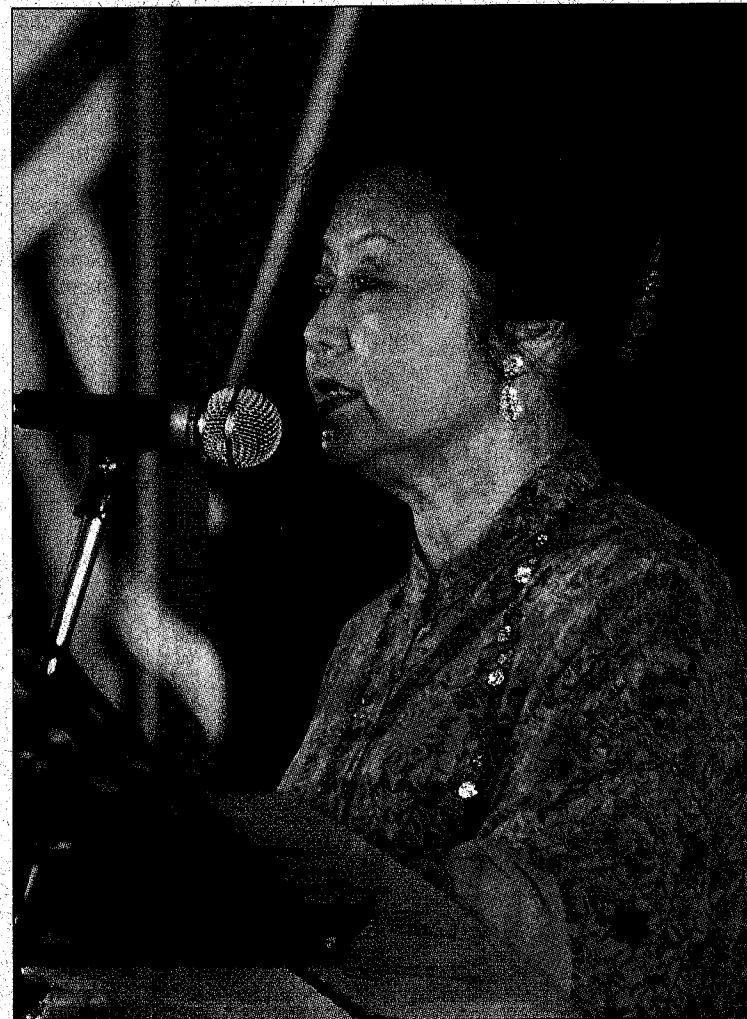
ENDON tidak ketinggalan mendeklamasi sajak berjudul Tanah Jantung.

Badan Budaya TNB turut mengadakan persembahan kebudayaan.