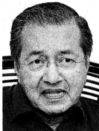
Dr Mahathir Mohamad

Goh menulis: "... Saya sebenarnya bersedia untuk memberi konsesi (concessions) dengan mengubah suai Points of Agreement (POA) dengan beberapa bidang tanah tambahan, membenarkan pengeluaran awal bagi ca-