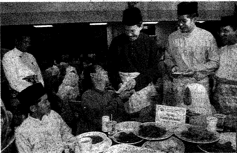
SUMBANGAN: Mohamad memberi duit raya kepada anak yatim sambil diperhatikan Naib Ketua Pemuda Umno, Khairy Jamaluddin pada majlis sambutan Aidilfitri 2005.