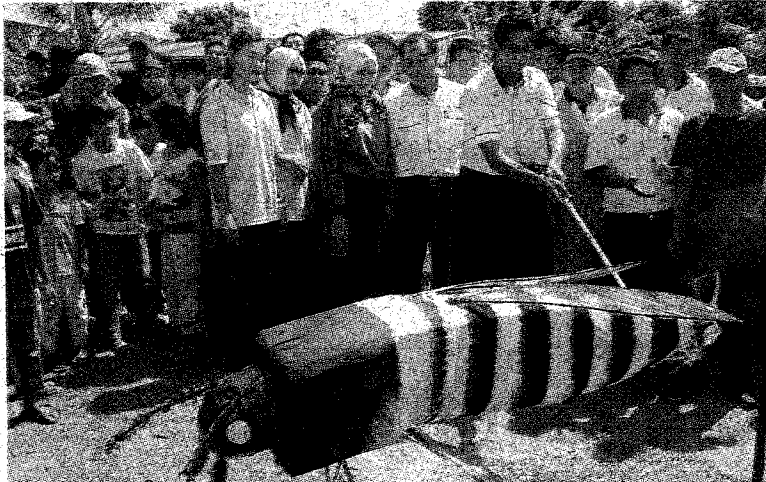
KEMPEN: Naib Ketua Pemuda Umno, Khairy Jamaluddin membakar patung gergasi nyamuk Aedes sebagai simbolik perasmian program Hapuskan Aedes, Cegah Denggi.