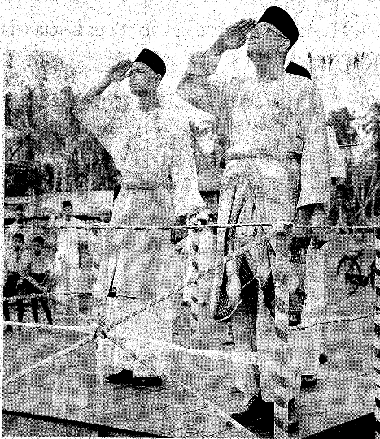
BAKAT MUDA: Tun Hussein mewarisi jiwa kepimpinan ayahnya, Datuk Onn Jaafar yang dikenali sebagai pengasas Umno.