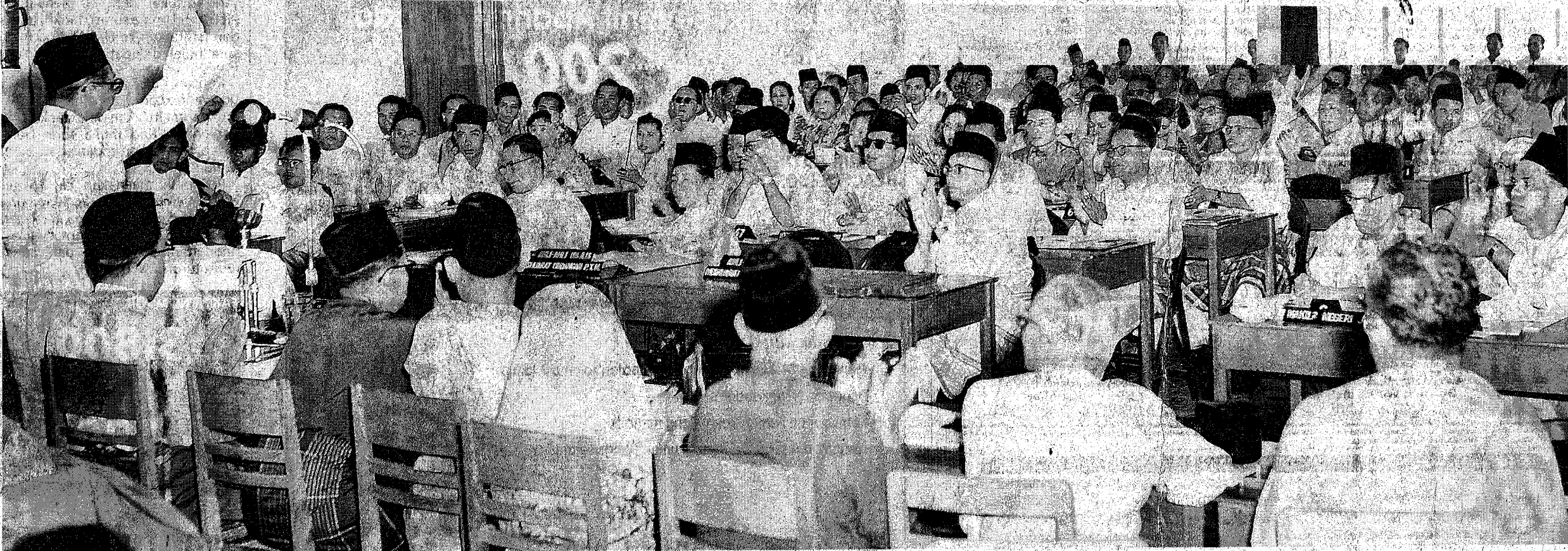
JIWA NASIONALISME: Wakil pertubuhan Melayu berucap penuh semangat dalam persidangan agung membincangkan penentangan gagasan Malayan Union yang menindas bangsa Melayu.