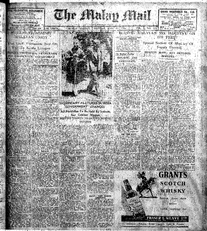
SEMANGAT MELAYU: Laporan akhbar pada Mei 1946.