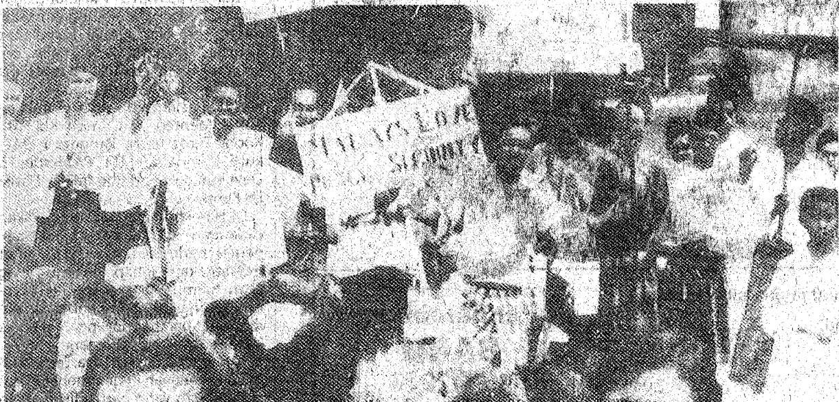
ANTIPENJAJAH: Selepas kelahiran Umno, ahlinya semakin bersemangat menyertai perhimpunan menentang Malayan Union.