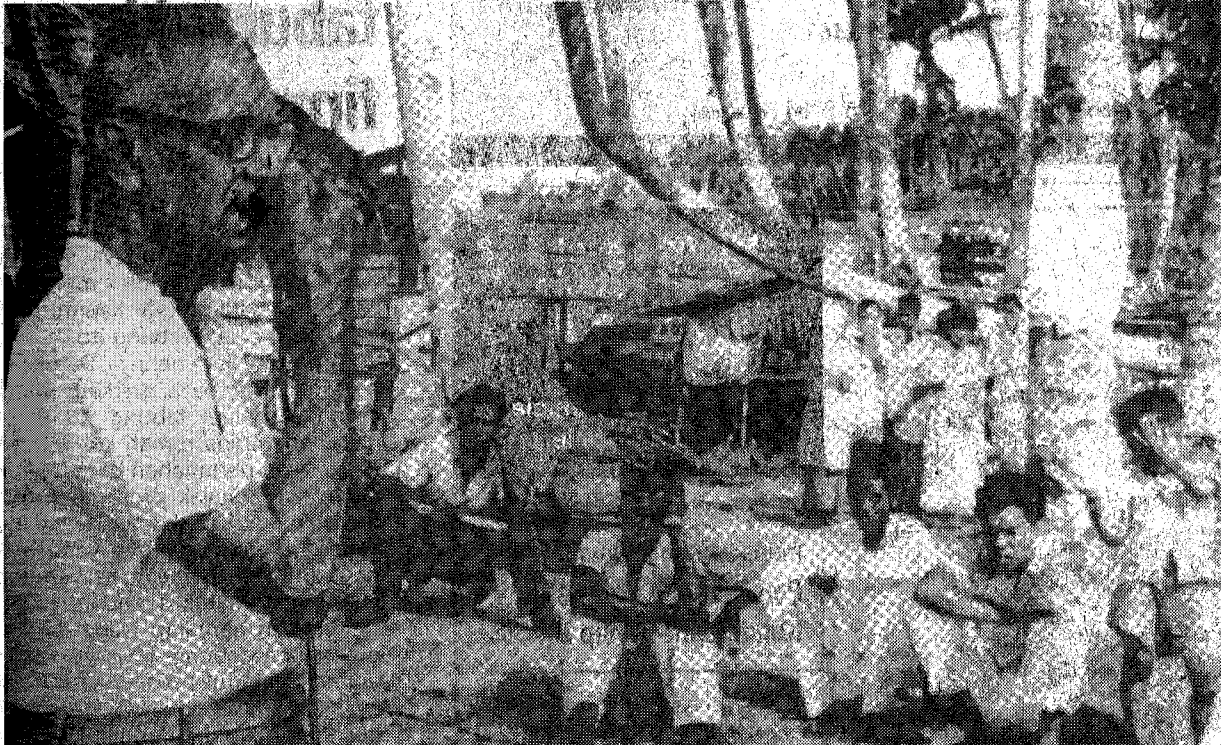
SUARA RAKYAT: Datuk Onn berkempen membangkitkan semangat bela Melayu menentang gagasan Malayan Union.