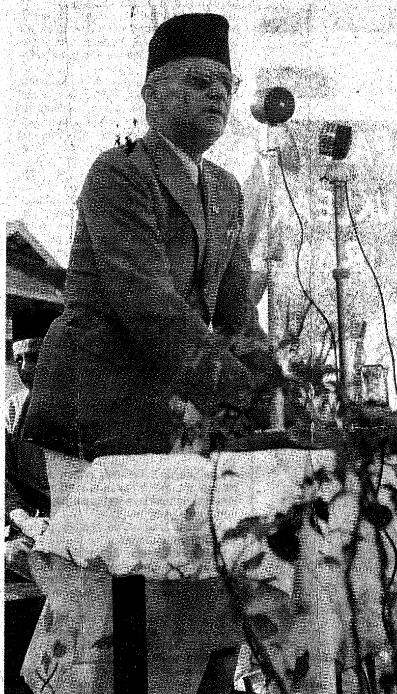
AMANAT: Datuk Onn selaku Presiden Umno menyampaikan amanat kepada penduduk Melayu pada satu perhimpunan di Pulau Pinang pada Januari 1941.