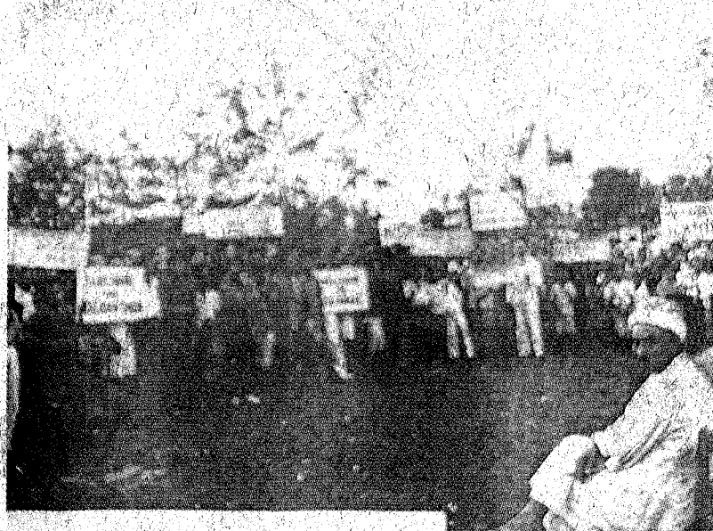
LUAH PERASAAN MARAH: Orang Melayu membuat demontrasi menentang penubuhan Malayan Union di Batu Pahat, Johor, pada Mei 1946.