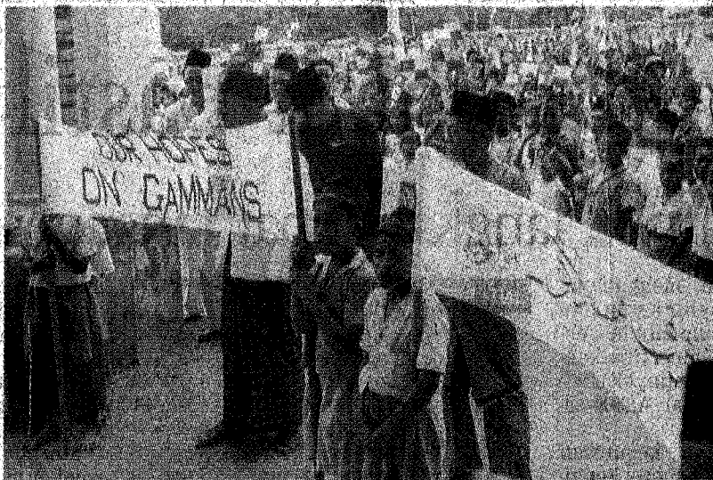
SEMANGAT KEBANGSAAN: Kanak-kanak turut serta ketika perhimpunan menentang Malayan Union.