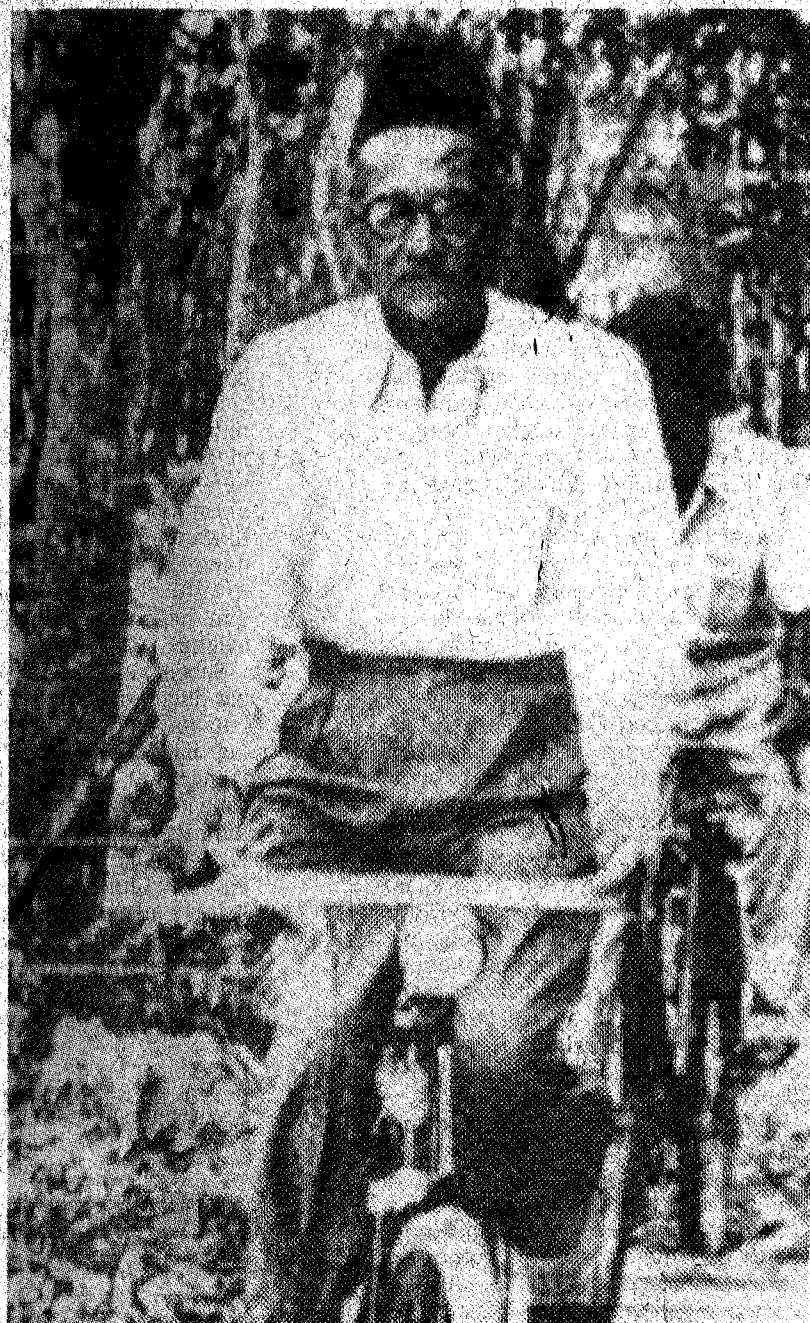
SEMANGAT WAJA: Datuk Onn berbasikal menjelajah kampung untuk berkempen.