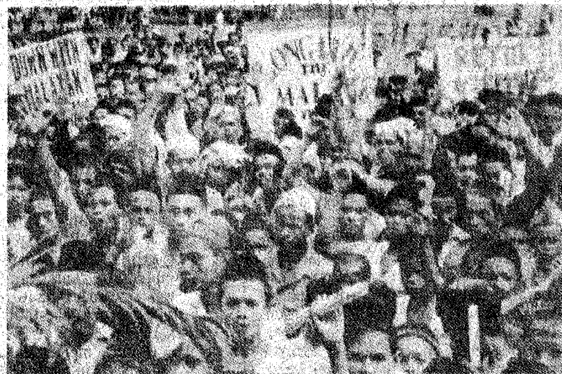
TAK PUAS HATI: Orang Melayu membuat demontrasi menentang penubuhan Malayan Union pada Mei 1946.