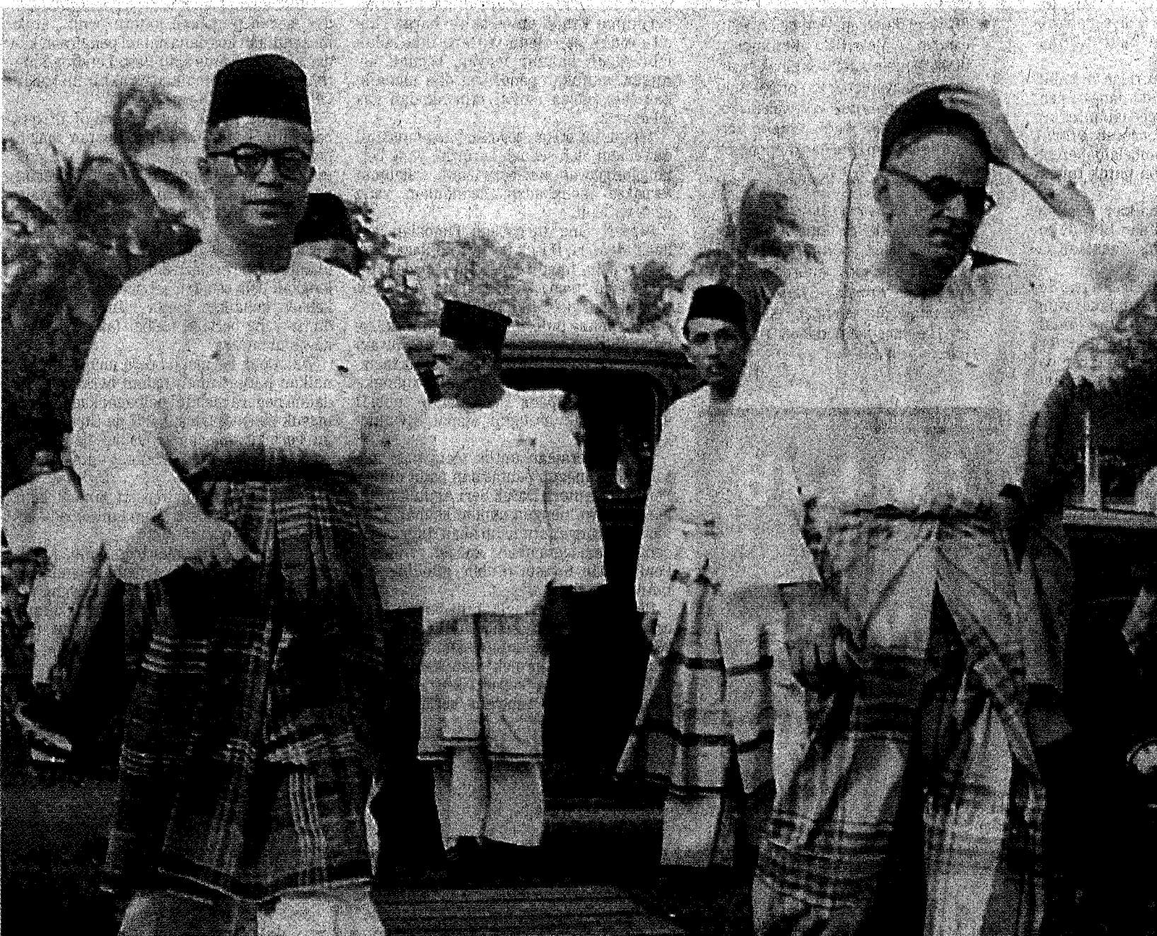
RELA BERPELUH: Datuk Onn ketika menghadiri satu majlis di Batu Pahat pada 1946.