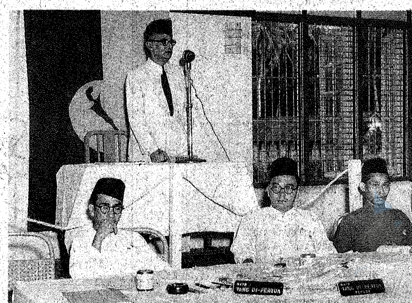
PENUH BERDEDIKASI: Datuk Onn bersemangat ketika berucap pada majlis Umno pada 1951.