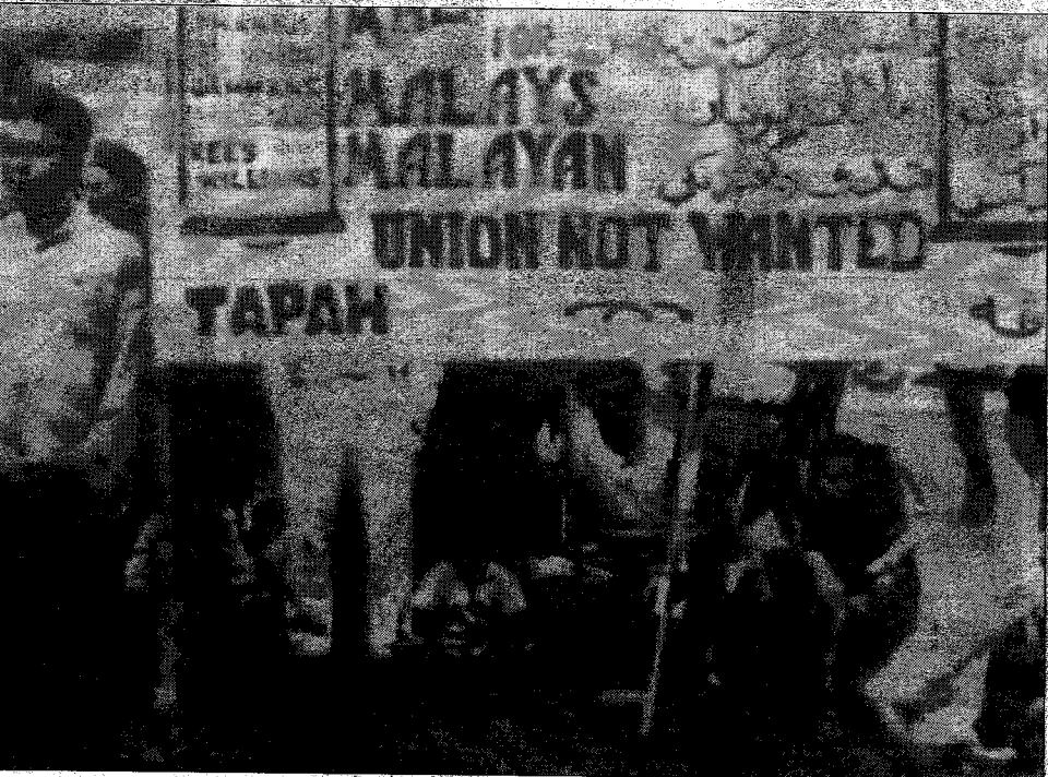
KONTIGENSI dari Tapah dalam perhimpunan tunjuk perasaan menentang Malayan Union.

Bahagian-bahagian UMNO di Perak kemudiannya dipecahkan kepada sembilan bahagian mengikut jumlah jajahan dalam negeri Perak.