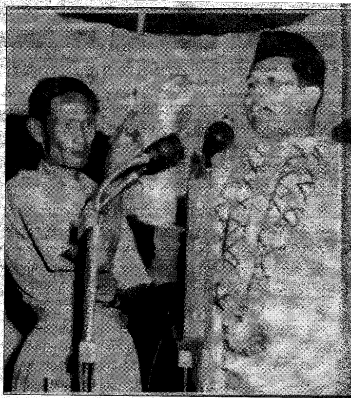
DATUK Panglima Bukit Gantang Wahab di Melaka pada tahun 1956.