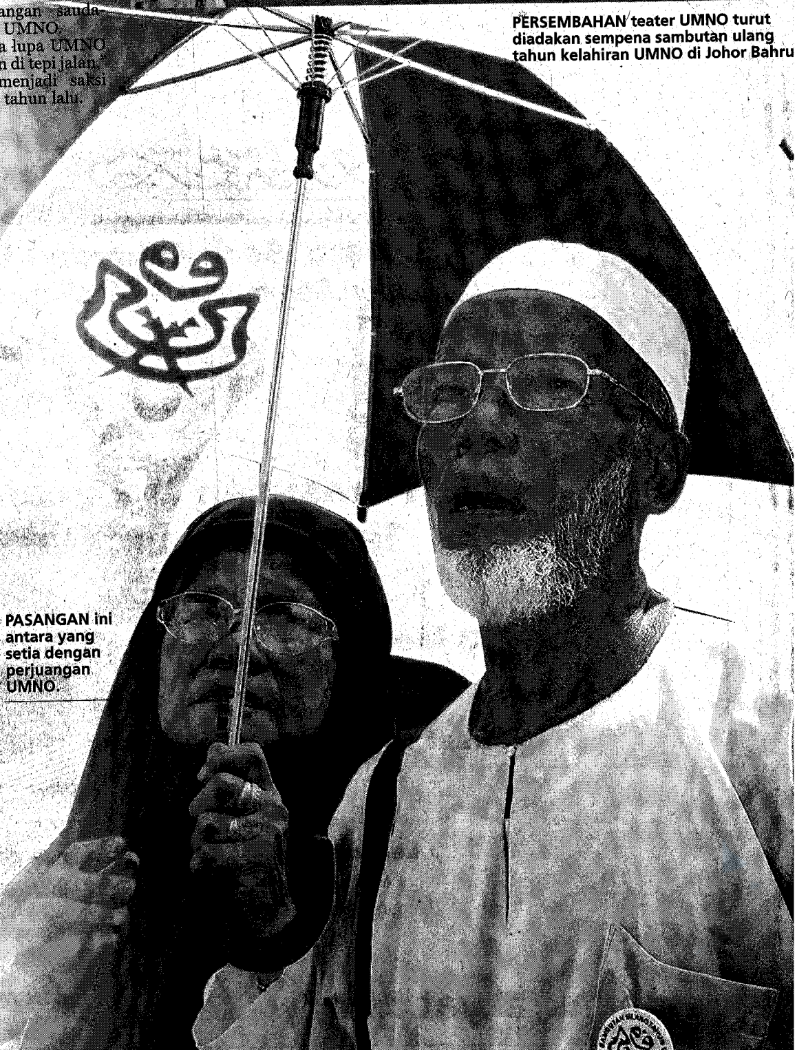
PASANGAN ini antara yang setia dengan perjuangan UMNO.