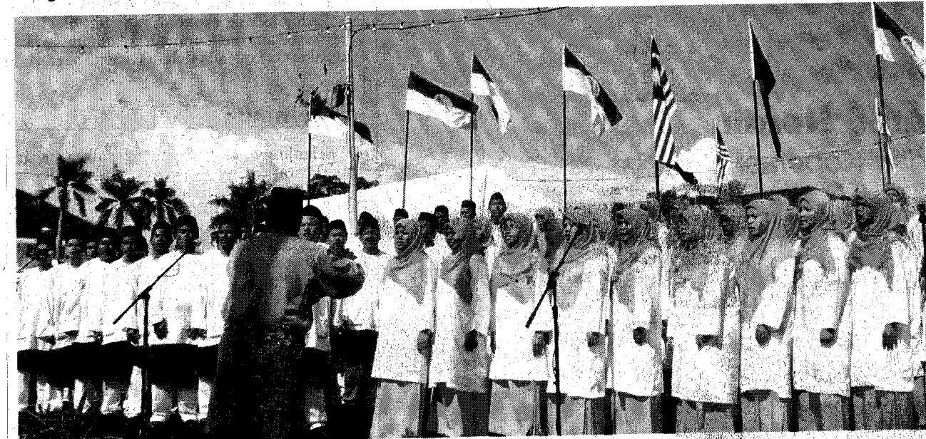
PUTERA dan Puteri yang bakal meneruskan kepimpinan UMNO pada masa depan.