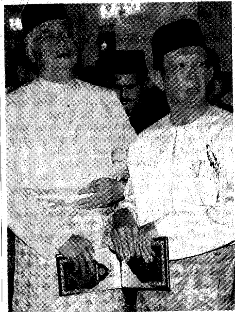
NAJIB Tun Razak dan Musa Hitam semasa menghadiri majlis tahlil.