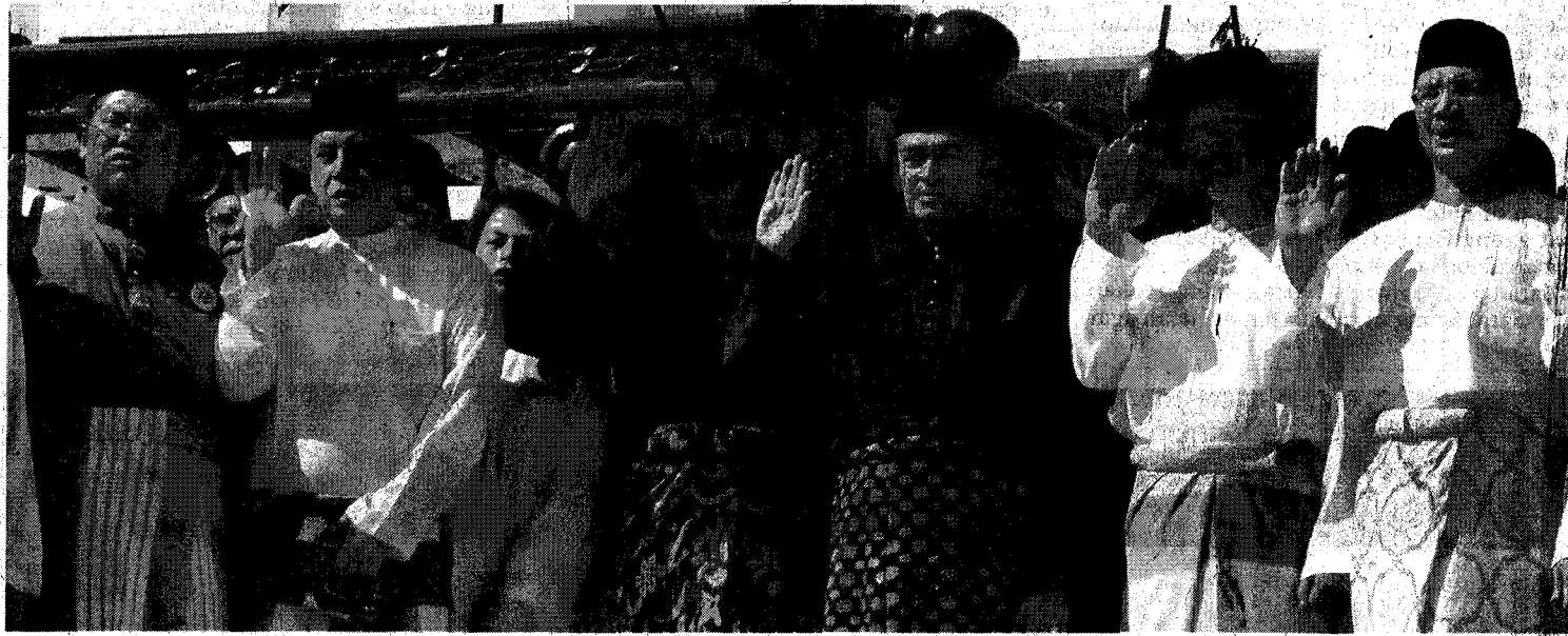
IKRAR... Pemimpin-pemimpin UMNO melafazkan ikrar semasa sambutan ulang tahun UMNO ke-60.

Dapat dirasakan oleh setiap yang hadir bagaimana Istana Besar Johor Bahru pada 11 Mei 1946 menjadi saksi kepada kelahiran UMNO yang kini menjadi tunjang bangsa Melayu dalam memperjuang dan memper-tahankan kemerdekaan negara. Menyambung warisan pemimpin terdahulu, Presiden UMNO, Datuk Seri Abdullah Ahmad Badawi membangkitkan semangat khalayak yang hadir dengan mengajak seluruh orang Melayu berusaha gigih untuk mencapai kejayaan dalam memastikan mereka muncul sebagai kaum yang maju pada tahun 2020. "Kita mesti dukung ia dengan erat dengan kekuatan dan kesedaran yang penuh bahawa kita mahu menjadi bangsa yang maju pada tahun 2020. "Mudah-mudahan para pemimpin kita ketika itu akan dapat bangun dengan penuh kesyukuran kepada Allah dan berasa megah untuk mengumumkan kepada bangsa kita dan seluruh negara bahawa bangsa kita (telah) maju dan negara kita (telah) maju," katanya sambil disahut dengan laungan 'Hidup Melayu'.