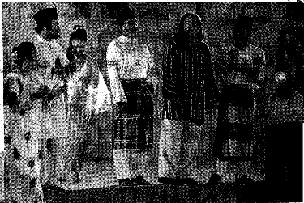
PERSEMBAHAN teater UMNO turut diadakan sempena sambutan ulang tahun kelahiran UMNO di Johor Bahru