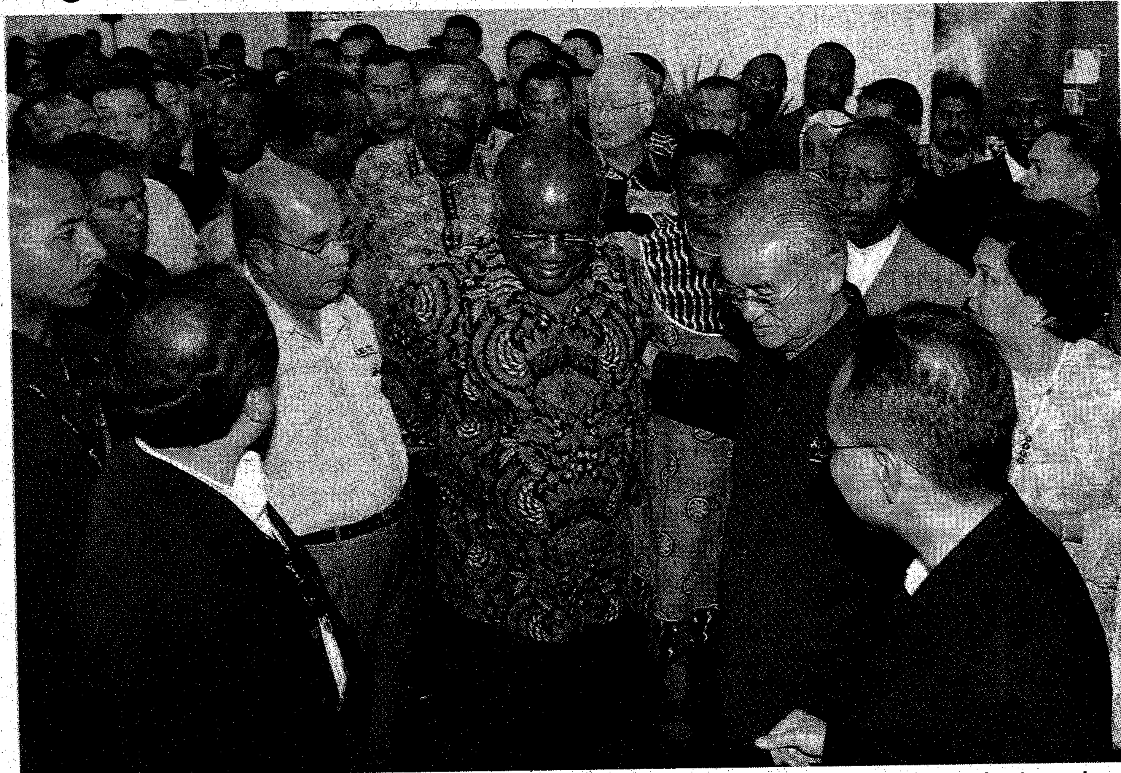
RAI TETAMU: Abdullah serta ketua negara yang menyertai LID melawat pameran Dialog Antarabangsa Langkawi, semalam. Turut hadir Datin Seri Jeanne Abdullah, Najib dan Syed Hamid.

Antara ketua kerajaan yang hadir termasuk Perdana Menteri Lesotho, Pakalitha Mosilili; Presiden Namibia, Hifikepunya Pohambe Puke; Pre-