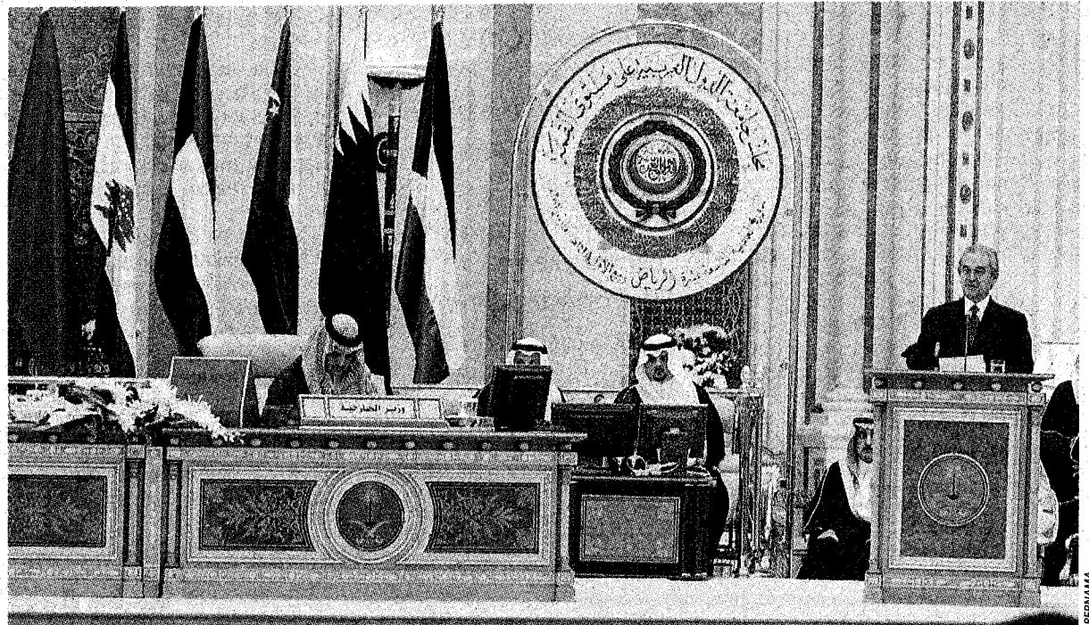
BERSEMANGAT TEGAS: Abdullah menyampaikan ucapan pada pembukaan rasmi Sidang Kemuncak Arab ke-19 di Riyadh, semalam.

"Kita di sini mampu selesaikan masalah di Asia Barat. Beribu penduduknya menderita, sengsara disebabkan peperangan tanpa kesudahan dan setiap hari mereka berharap pen-