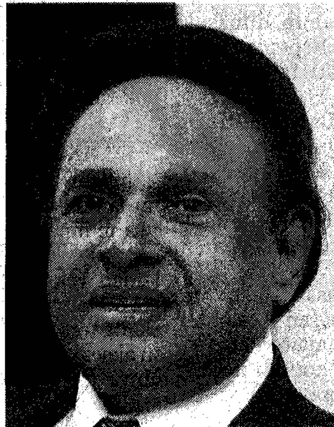
S. SAMY VELLU

Ditanya sama ada kerajaan dapat memberi jaminan kadar tol yang akan dikenakan munasabah dan tidak membebankan rakyat, Samy Vellu berkata, orang ramai perlu faham perbezaan pembinaan terowong ini dengan lebuh raya kerana kos pembinaan terowong menelan belanja yang