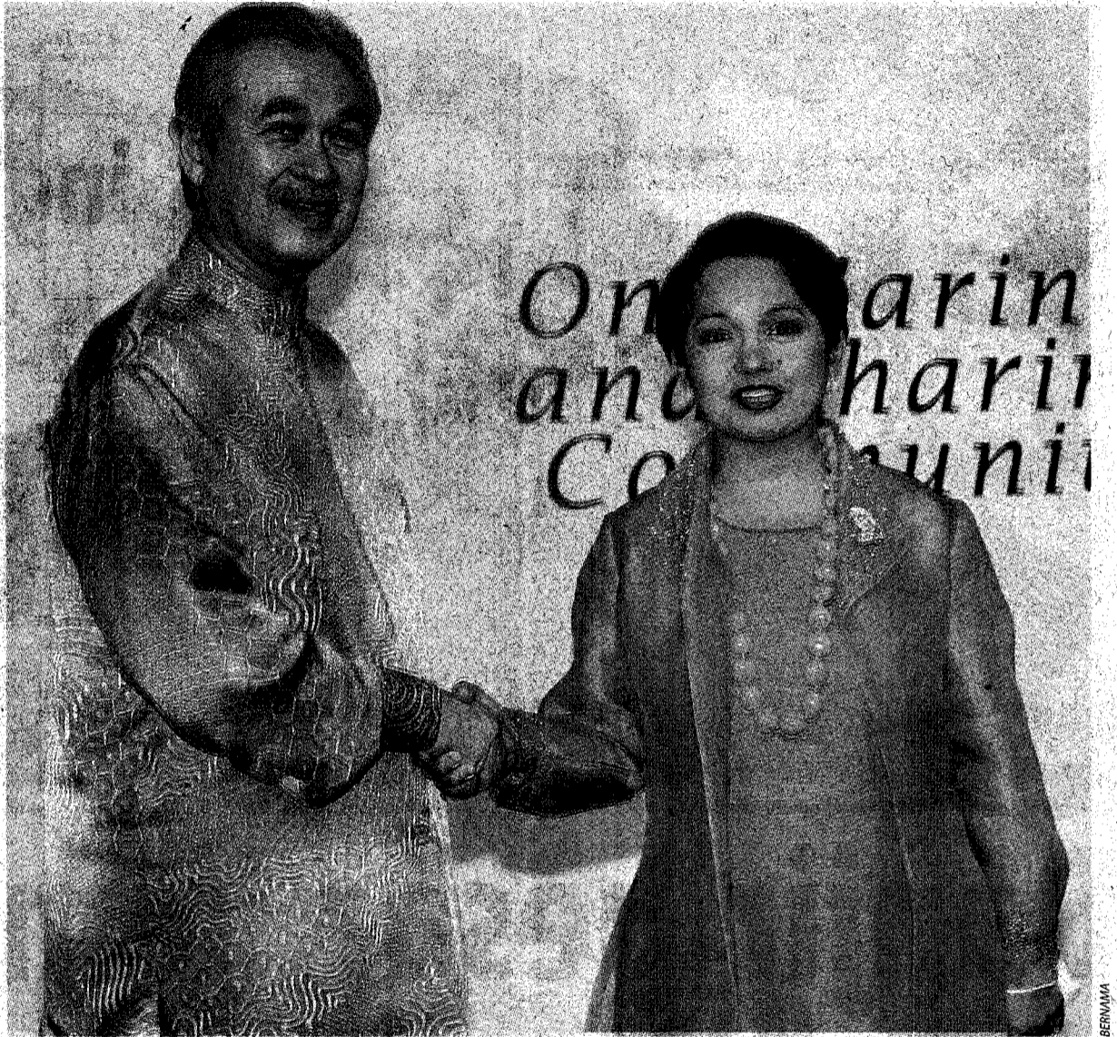
KERJASAMA ERAT: Abdullah bersalam dengan Arroyo ketika mesyuarat ketua negara atau kerajaan di Cebu City, semalam.

"Biarlah projek yang besar kesannya dan mampu menjana ekonomi