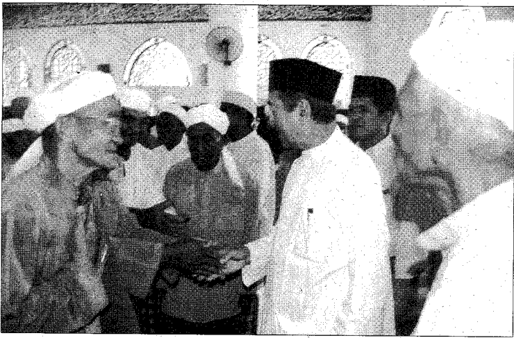
Para jemaah sedang berebut-rebut untuk bersalaman dengan bekas Perdana Menteri, Tun Mahathir Mohamad sejurus sampai di masjid untuk menunaikan sembahyang jenazah bagi Allahyarhamah.