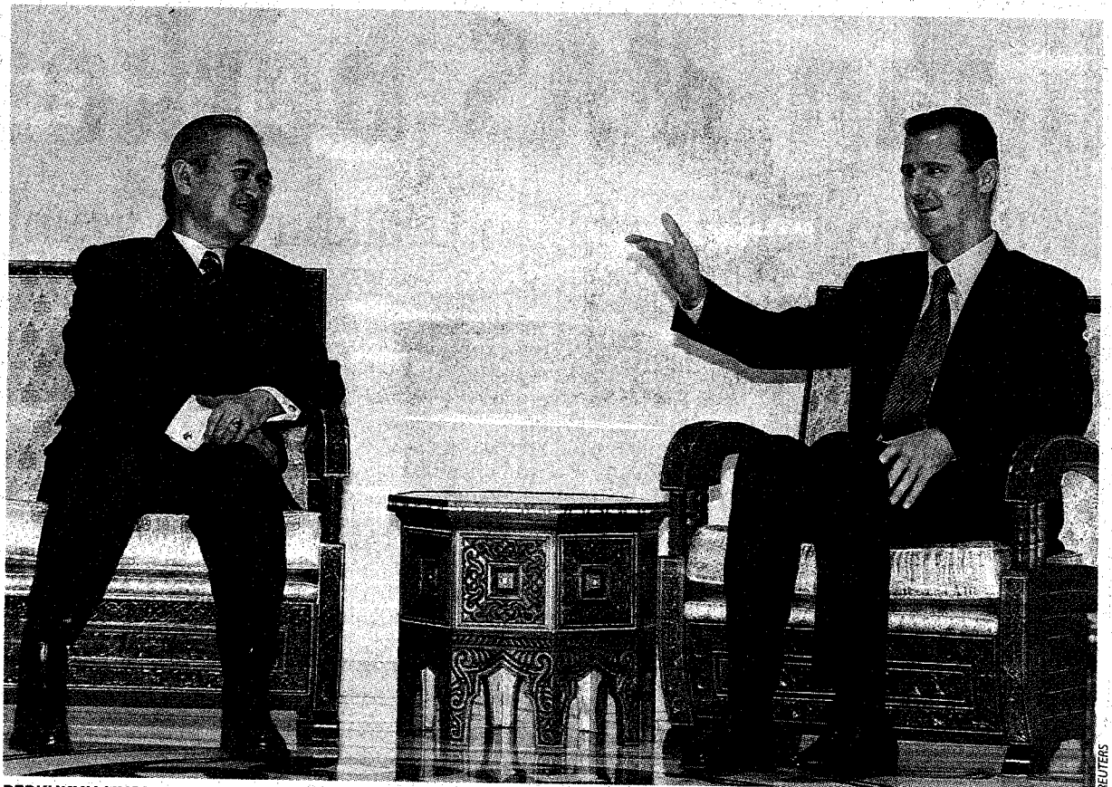
PERKUKUH HUBUNGAN: Abdullah berbual dengan Presiden Syria, Bashar Al-Assad sebelum menghadiri mesyuarat di Damsyik, semalam.

juga terhad, iaitu membabitkan makanan dan industri getah. Sehingga kini, pelaburan Syria diluluskan di Malaysia ialah RM34.3 juta," katanya.