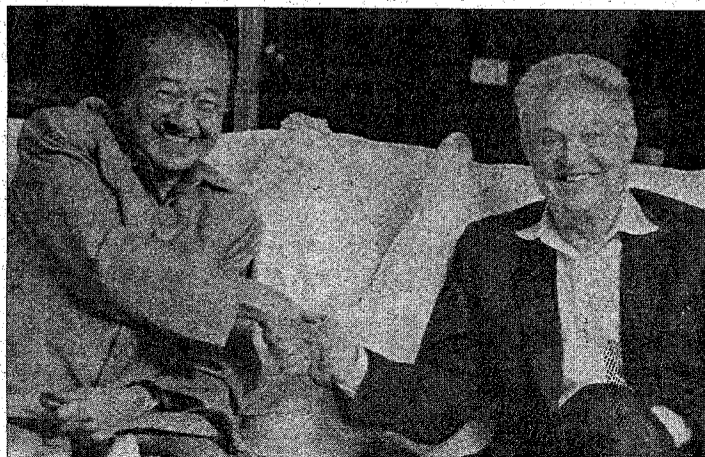
Soros dan Dr Mahathir ceria ketika bersalaman sesudah tamat perbincangan dan kedua-duanya bersetuju melupakan peristiwa lama.