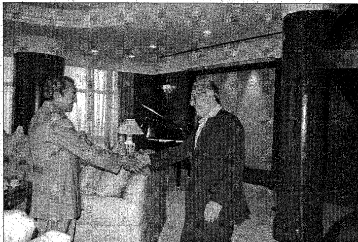
Dr Mahathir menyambut ketibaan George Soros di bilik perbincangan diadakan. Itu adalah pertemuan yang pertama bagi kedua-dua tokoh itu.