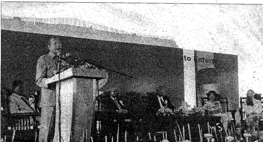
Tun Dr Mahathir memberi ucapan kepada para jempunan.