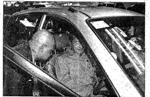
serta penjualan kereta nasional adalah di tahap yang baik, yang sebenarnya apa yang dimaksudkan oleh Tun ialah peningkatan yang lembap dan masih lagi di tahap yang lama. Keadaan semasa perlu digerakkan dengan agresif demi untuk mengekal serta meningkatkan prestasi penjualan dan ekonomi ke tahap yang paling cemerlang dan membanggakan.