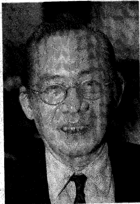
PROFESOR DR. KHOO KAY KIM

Beliau berkata demikian ketika diminta mengulas pengumuman Perdana Menteri, Datuk Seri Abdullah Ahmad Badawi mengenai tahun 2057 sebagai sasaran baru kerajaan