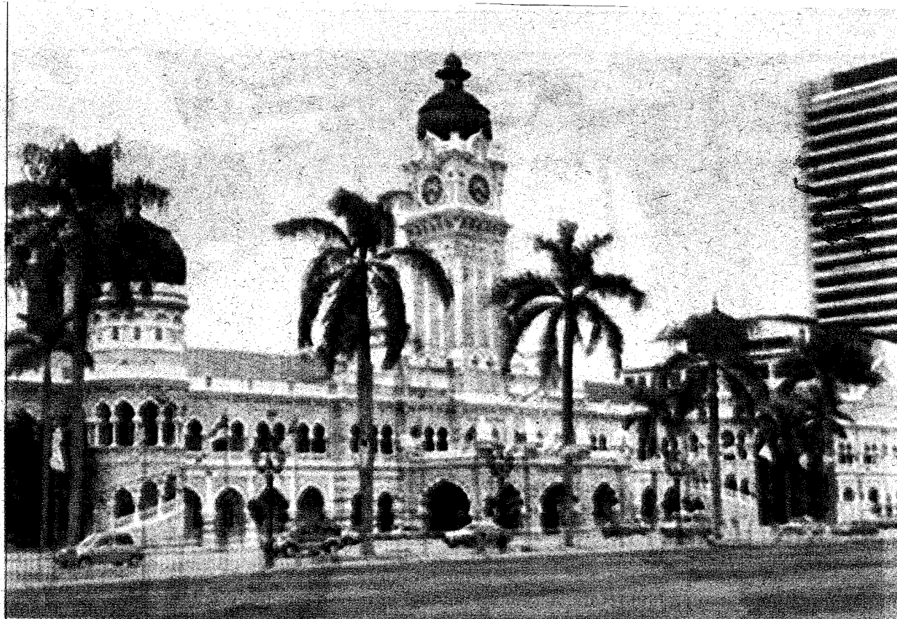
DATARAN Merdeka turut mempunyai sejarahnya yang tersendiri.