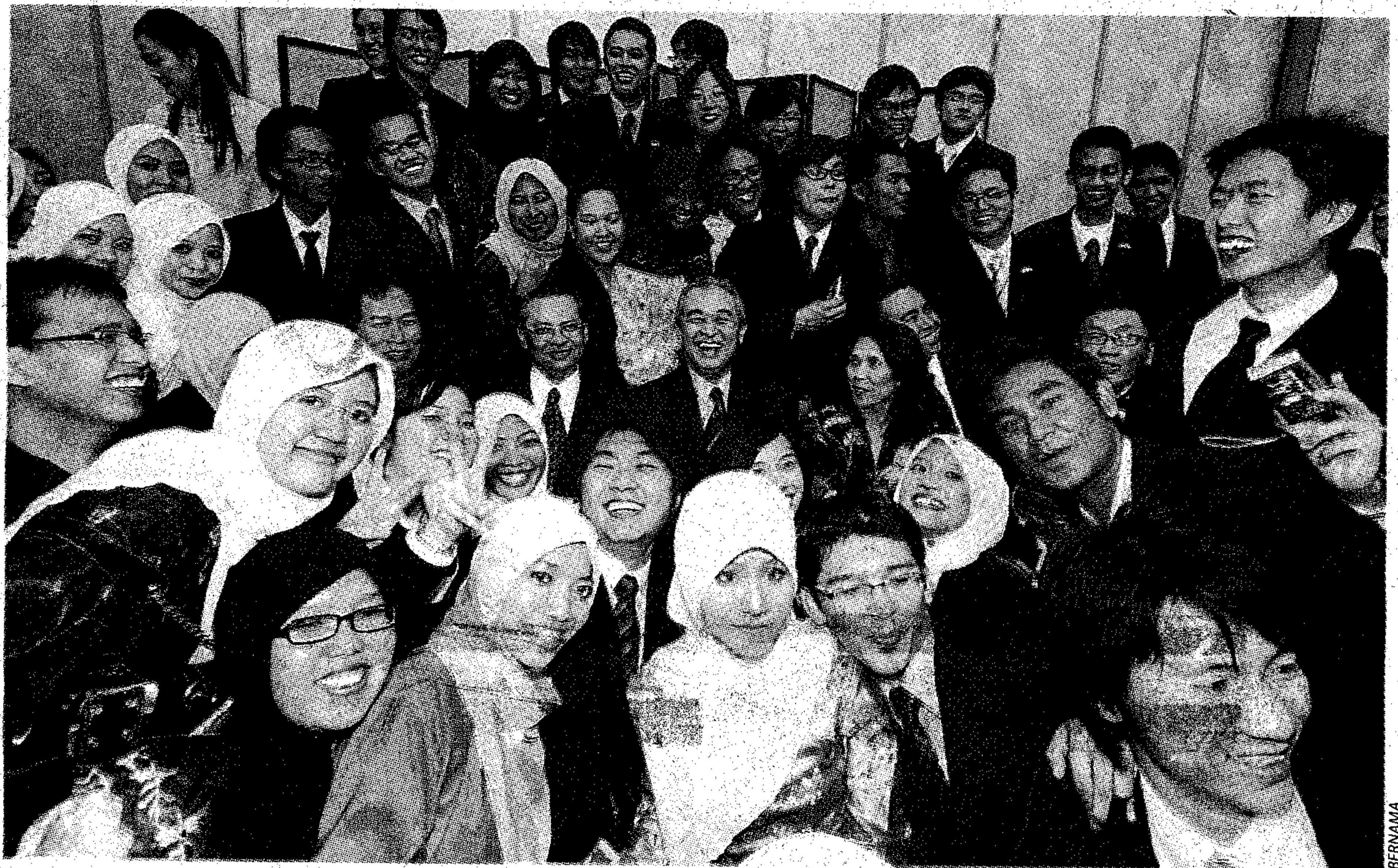
KENALI LEBIH DEKAT: Abdullah ceria bergambar ketika menghadiri majlis perjumpaan dan makan malam bersama pelajar Malaysia di Jepun, semalam.

Abdullah tiba di sini kira-kira jam 5.30 petang waktu tempatan untuk menghadiri majlis makan malam dengan pelajar Malaysia di bandar raya ini, sebelum pulang ke Kuala Lumpur, malam tadi.