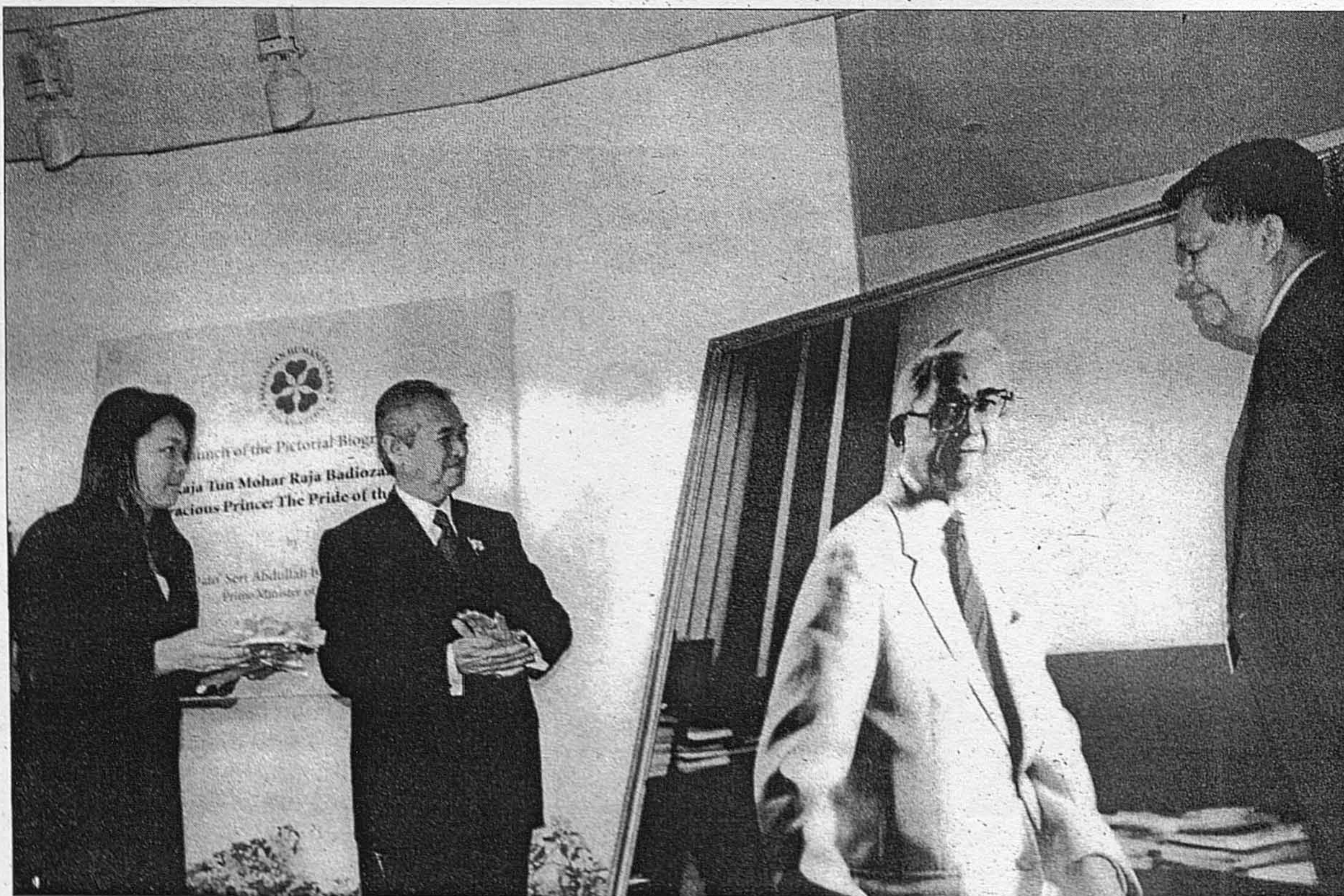
Perdana Menteri Dato' Seri Abdullah Ahmad Badawi dengan senyum melihat potret allahyarham Raja Tun Mohar setelah melancarkannya. Gambar yang sama digunakan bagi muka hadapan buku yang bertajuk 'A Pictorial Biography on Raja Tun Mohar Badiozaman A Gracious Prince: The Pride of The Nation'.

Disini disiarkan beberapa keping gambar yang telah dirakamkan oleh ERA BARU untuk tatapan pembaca.