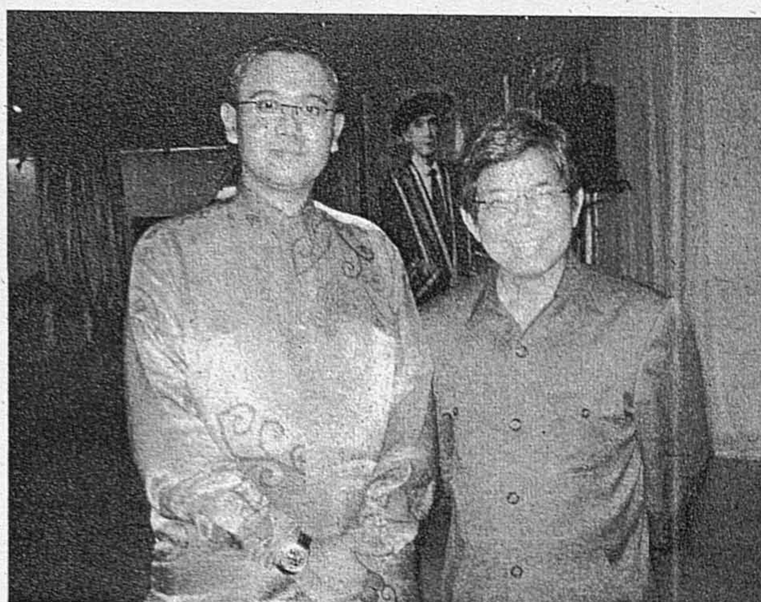
GAMBAR ATAS... Penulis menunjukkan gambar Raja Tun Mohar yang mengetuai rombongan ketika membuat lawatan rasmi ke Moscow, Rusia untuk menjalani hubungan diplomatik di antara Malaysia dengan negara Komunis itu pada tahun 1966.