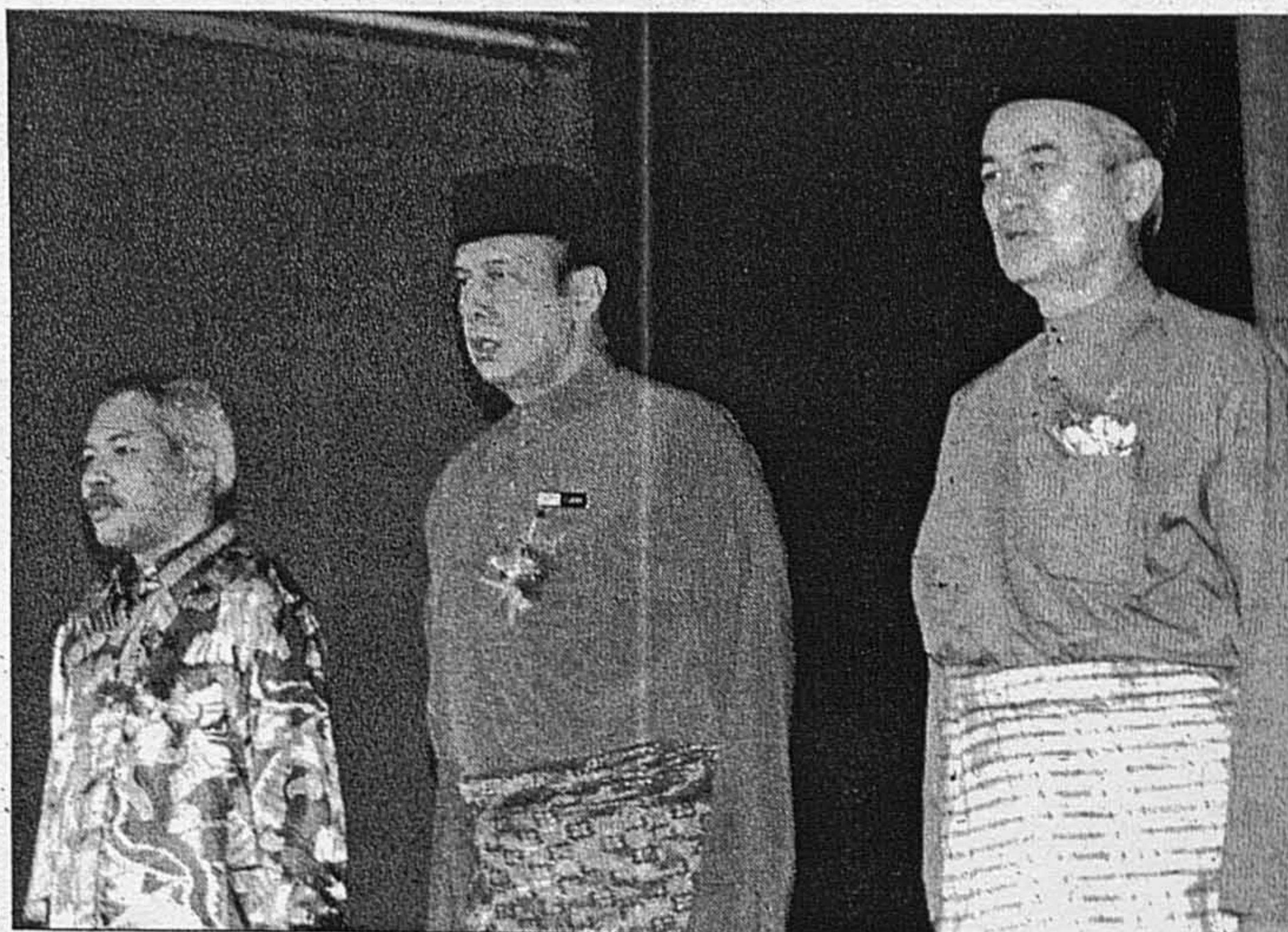
DENGAN SEMANGAT... Pak Lah bersemangat menyanyikan lagu Negaraku dan UMNO dengan diiringi bersama oleh Datuk Seri Mohamad Khir Toyo dan Tan Sri Rahim Tamby Chik.

Diharapkan agar GABEM akan terus memantau dan sentiasa menjadikan kaum Melayu yang Terbilang di dalam bidang ekonomi.