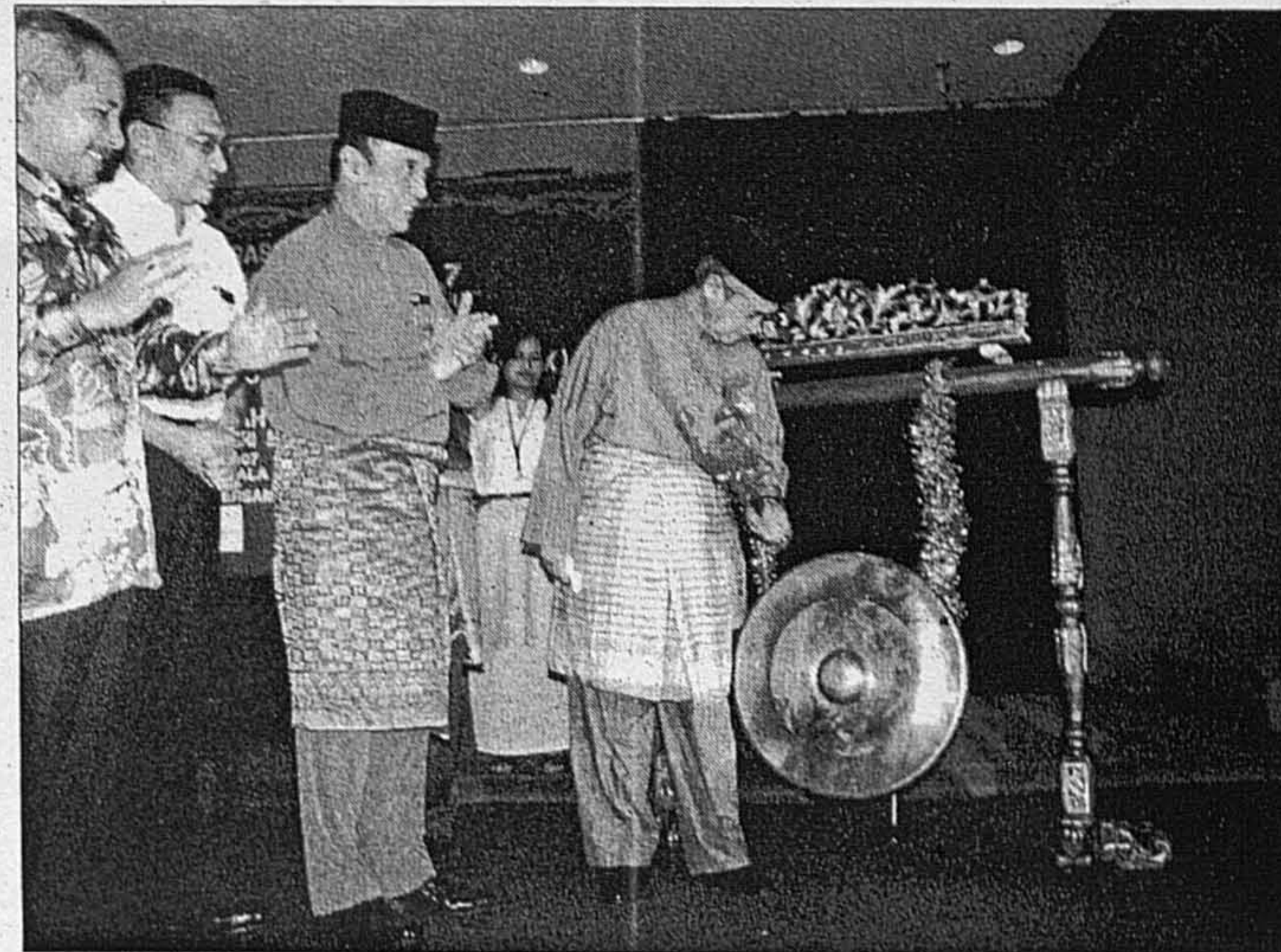
Pak Lah memukul gong, yang menandakan perasmian Kongres Jihad Ekonomi sambil disaksikan oleh Datuk Seri Mohamad Khir Toyo, Datuk Hishamuddin Tun Hussein serta orang kuat GABEM, Tan Sri Rahim Tamby Chik.

> Sebahagian daripada peserta dan para jemputan dari seluruh negara yang hadir di Kongres Jihad Ekonomi yang dianjurkan oleh GABEM.