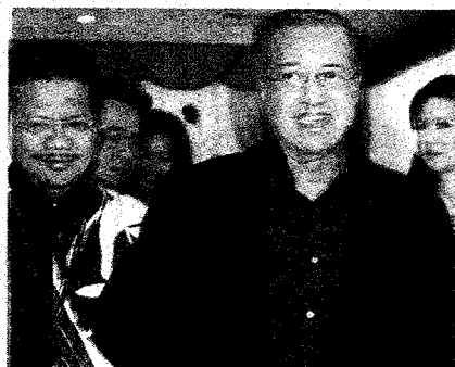
Gambar Tun Dr. Mahathir yang dirakamkan ketika beliau menyaksikan Teater P. Ramlee Musical di Istana Budaya