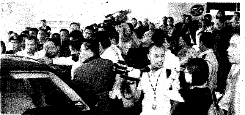
Berpuluh-puluh wartawan dan jurugambar membuat liputan apabila Tun Dr Mahathir meninggalkan IJN.