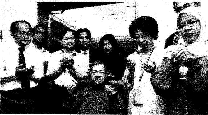
Sebelum meninggalkan biliknya, doa selamat dan kesyukuran dibaca dan diaminkan oleh doktor-doktor dan jururawat yang menjaga Tun selama berada di IJN.