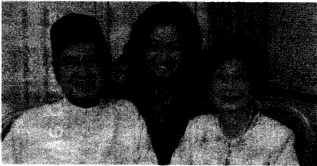
Datuk Paduka Marina Mahathir tersenyum gembira bersama ayah dan bonda tercinta Tun Dr Mahathir dan Tun Dr Siti Hasmah ketika bersama-sama menyambut Hari Raya Aidilfitri di IJN.