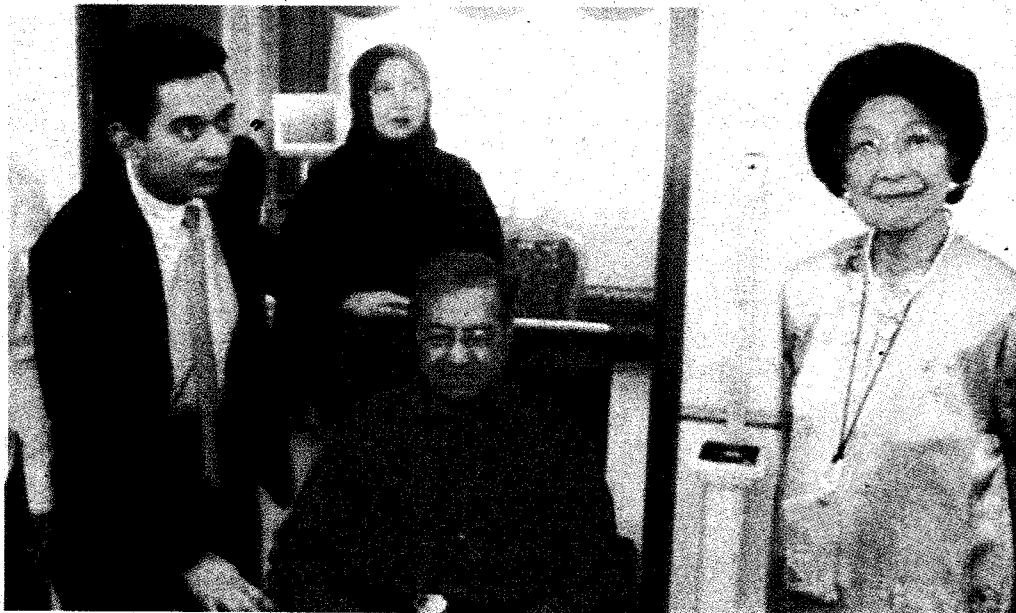
Tun Dr Mahathir kelihatan segar ketika duduk di kerusi di IJN dengan ditemani oleh Tun Dr Siti Hasmah sebelum keluar untuk pulang ke rumah.