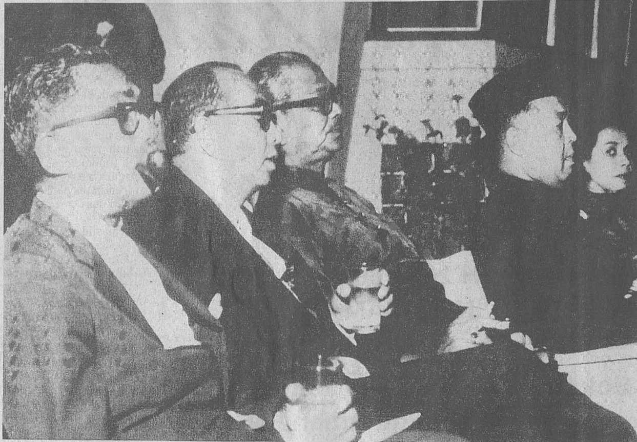
PERJUANG KEAMANAN: Yang di-Pertuan Agong dan Raja Permaisuri (kanan) bersama tiga pemimpin negara (dari kiri) Dr Ismail, Tun Abdul Razak dan Tunku Abdul Rahman ketika menghadiri sambutan Hari Kebangsaan, di Stadium Merdeka pada 31 Ogos 1965.

Walaupun, gagal dalam permohonan untuk ke Hong Kong, Dr Ismail berjaya mendapat tempat di Universiti Melbourne, satu peristiwa dianggapnya 'mujur sekali'. Dengan ber-