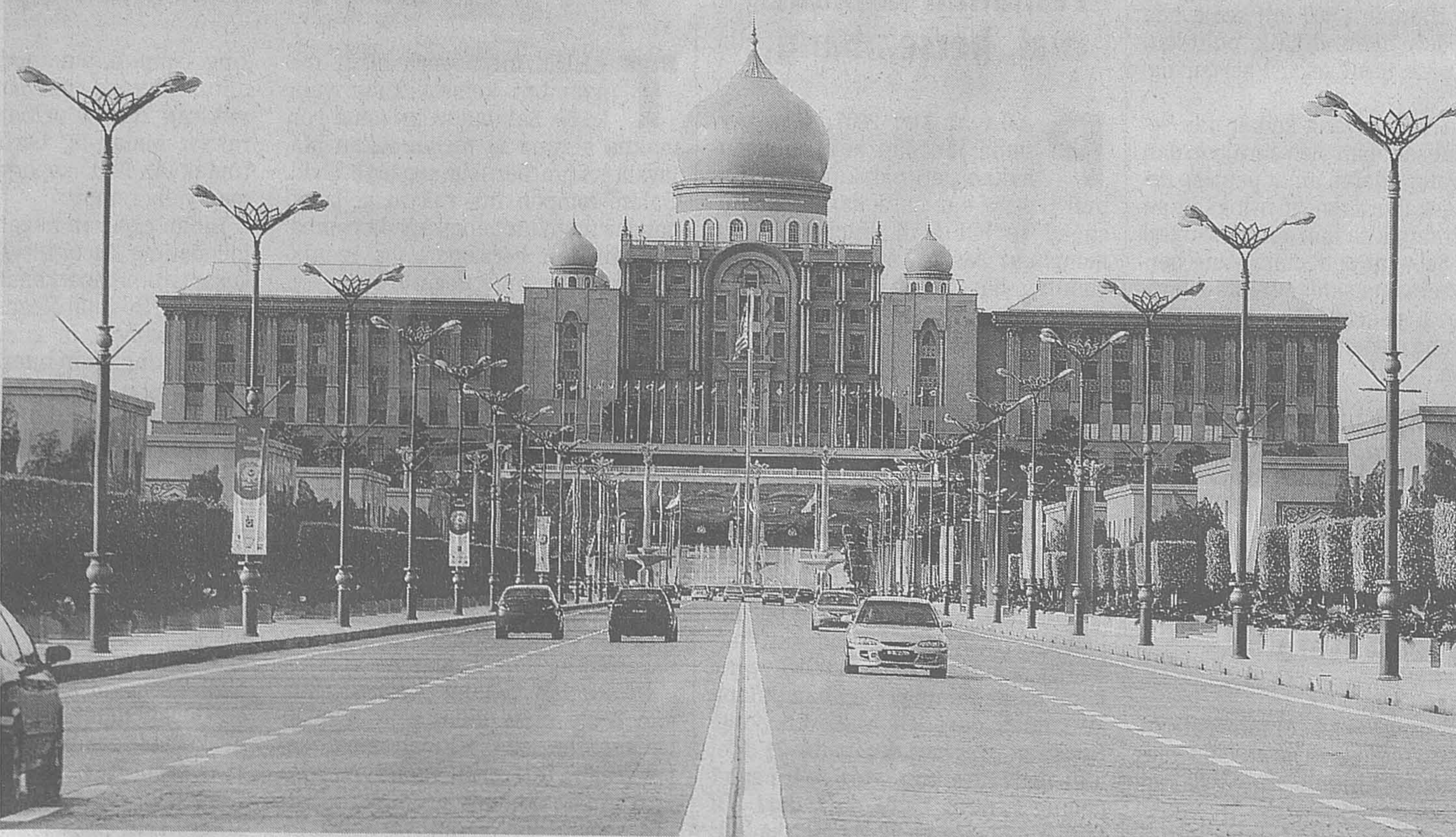
MODEN DAN INDAH: Keindahan seni bina meletakkan Putrajaya antara kota terindah yang menjadi tumpuan pelancong.

(Penulis yang kini bertugas di Pusat Kebudayaan Universiti Malaya, pernah menjalankan penyelidikannya di kota warisan Asia Tenggara. Rencana disediakan Sekretariat Media, Sambutan Kemerdekaan Ke-50)