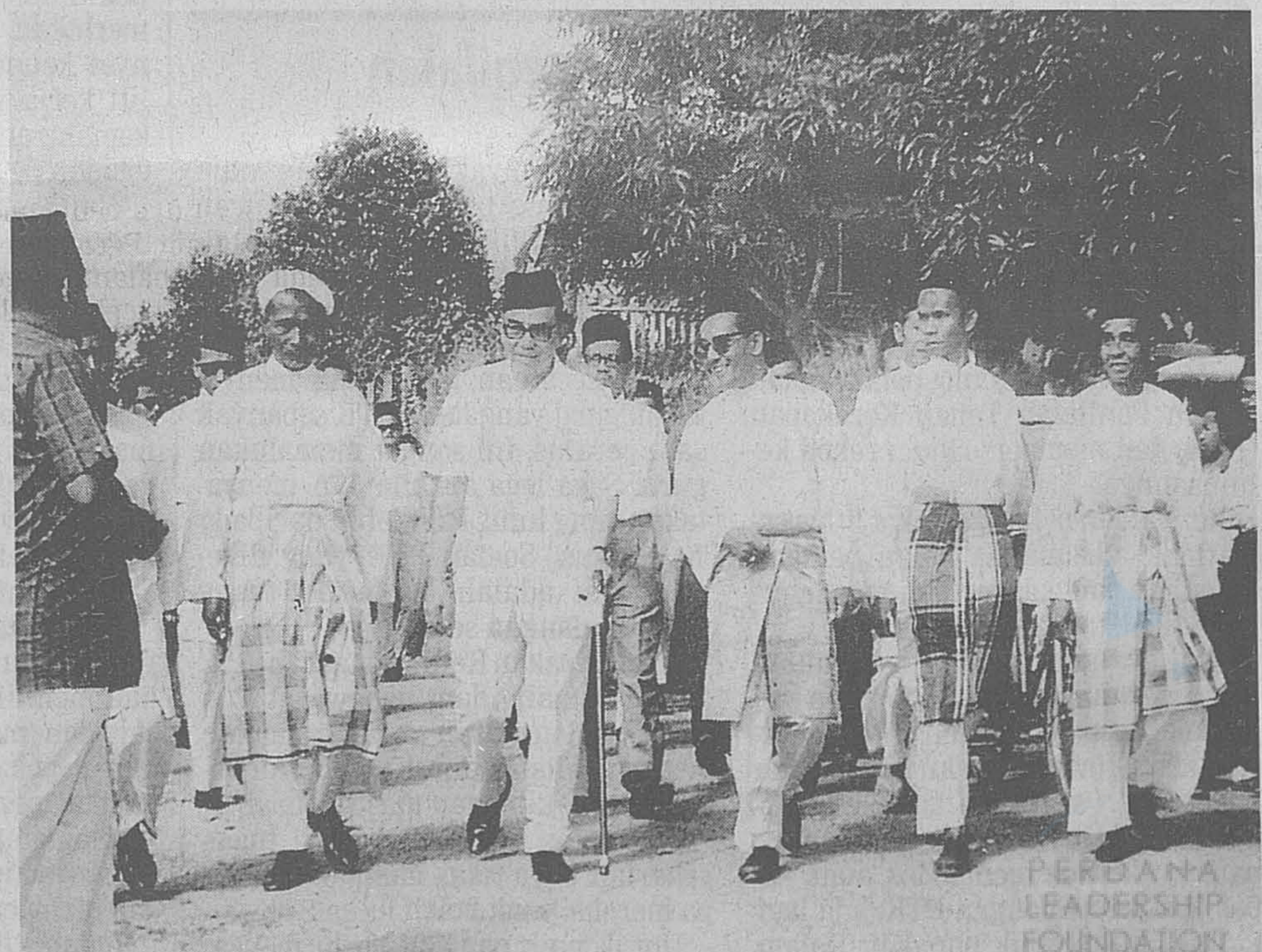
BANTU PENEROKA: Tun Razak Hussein melawat Felda Lurah Bilut pada dekad 60-an untuk meninjau masalah peneroka.

(Nota: Rencana ini disediakan oleh Sekretariat Media, Sambutan, Kemerdekaan Ke-50)