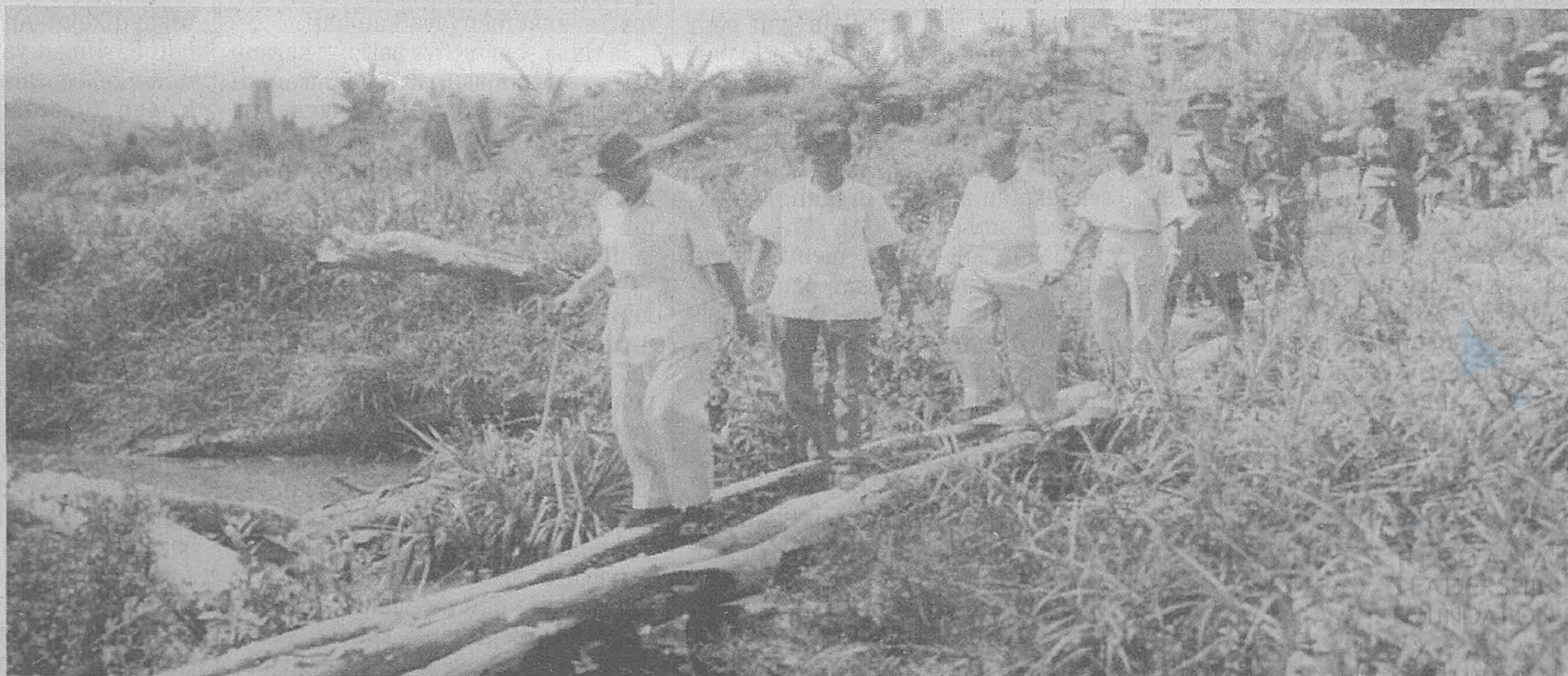
KAWASAN BARU: Razak gigih meneroka dan membuka tanah baru untuk membasmi kemiskinan rakyat.

Rencana disediakan Sekretariat Media Kementerian, Kesenian, Kebudayaan dan Warisan sempena ulang tahun ke-50 kemerdekaan negara.