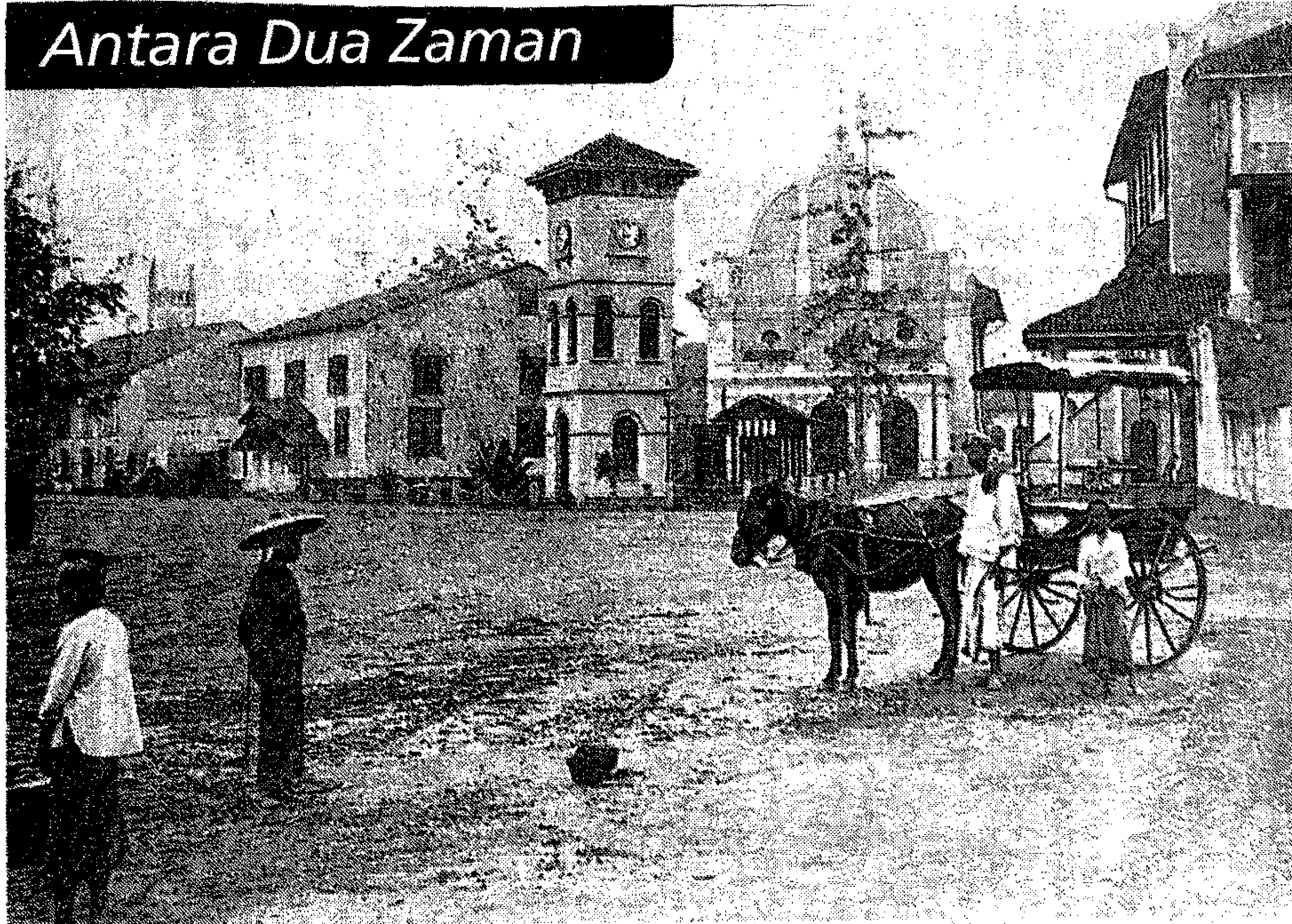
DULU Pemandangan bangunan Stadthuys hasil seni bina Belanda pada masa lampau di Melaka.