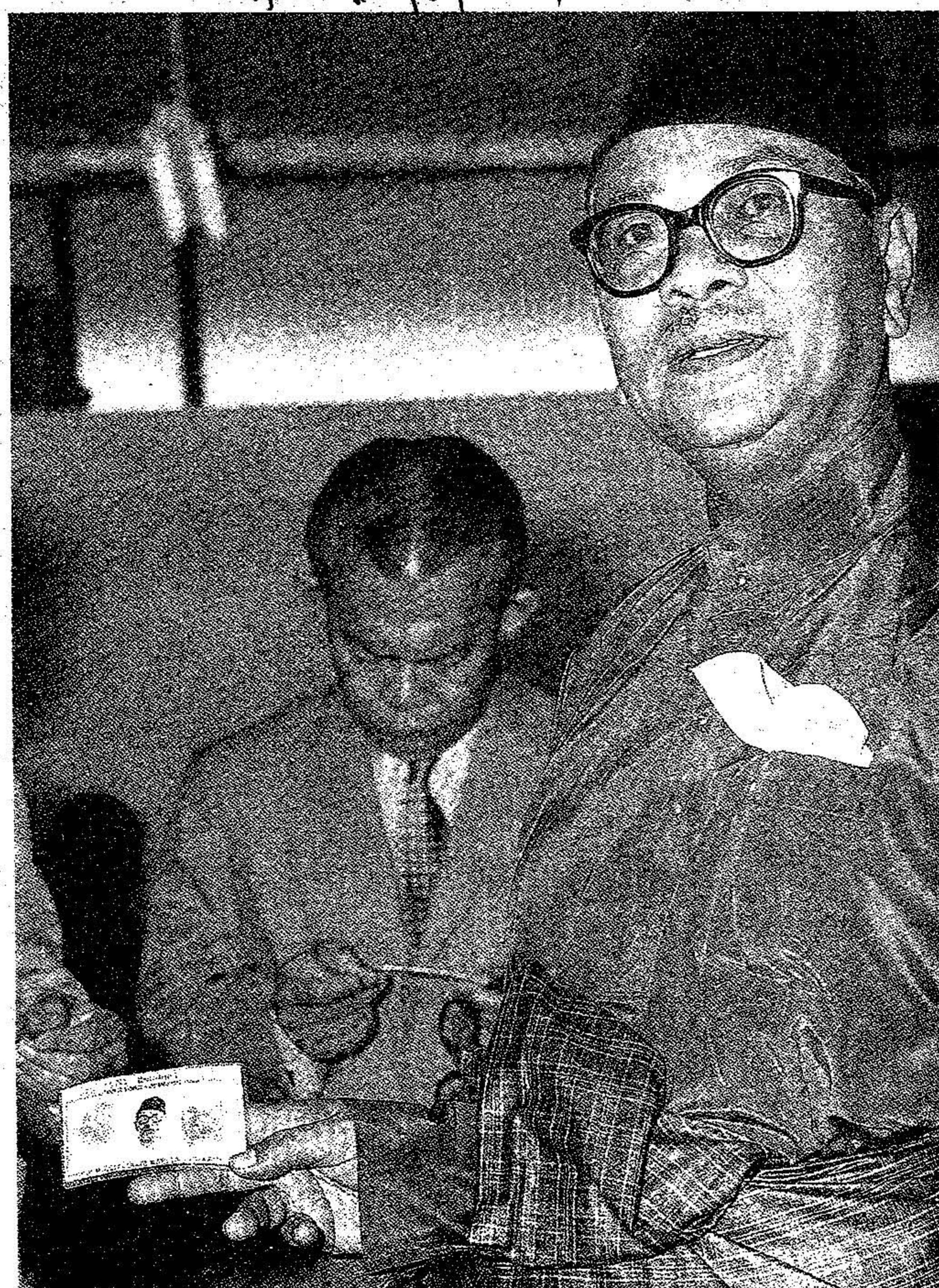
TUNKU Abdul Rahman memegang kad pengenalan pertama selepas Malaysia merdeka.

Tidak kurang menarik, maklumat berhubung 110,000