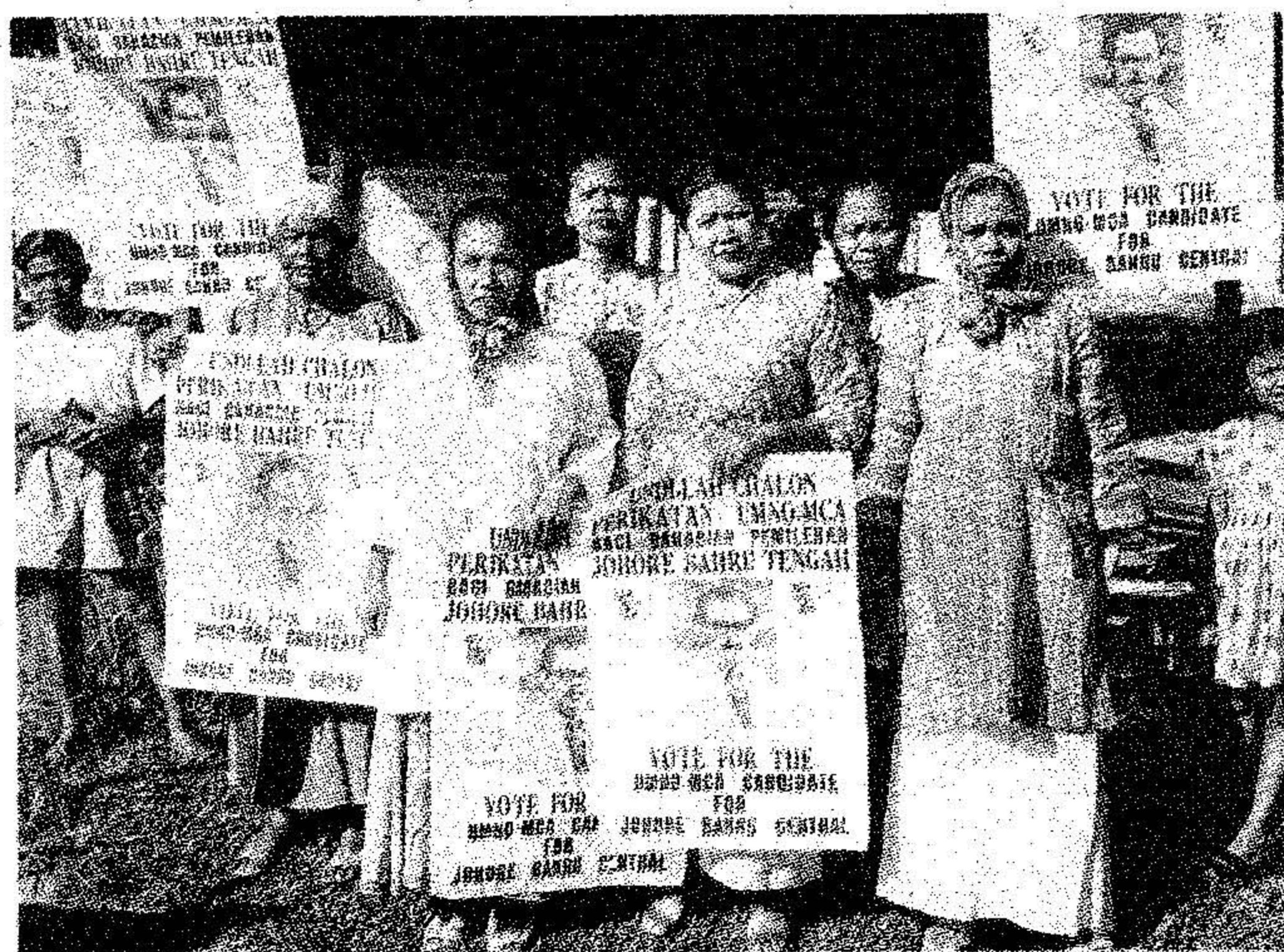
WANITA beri sokongan kepada calon Umno dalam pilihan raya pertama Malaysia.

Pada 31 Ogos 1957, dengan disaksikan 25,000 orang di Stadium Merdeka, Tunku Abdul Rahman membacakan perisytiharan kemerdekaan dan sambil mengangkat tangan, Bapa Kemerdekaan Malaysia itu melaungkan merdeka sebanyak tujuh kali.