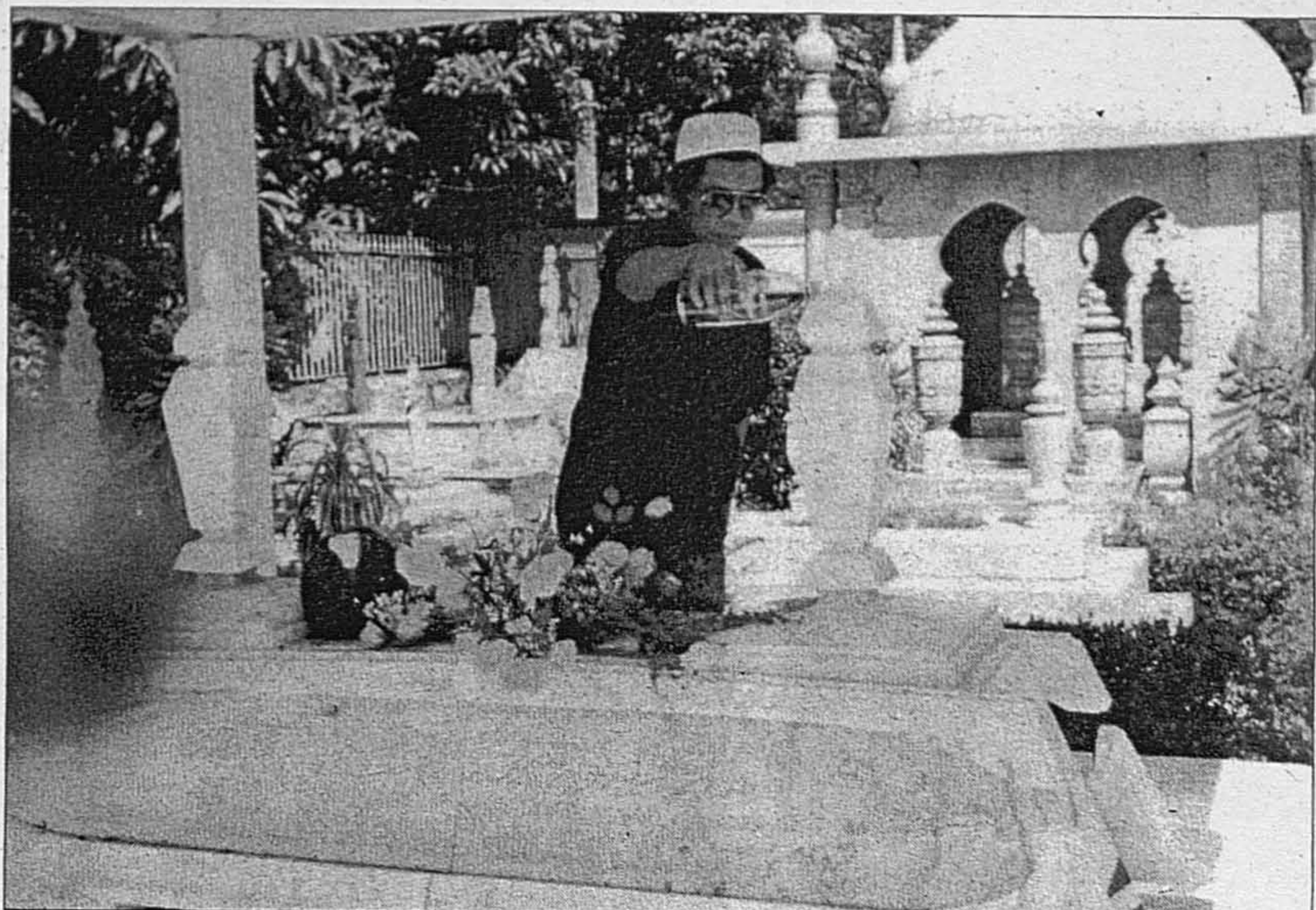
GAMBAR ATAS... Penulis sedang menyiram air mawar ke atas makam Tunku di Langgar, Alor Star pada salah satu kunjungan beliau ke makam Tunku.

Jenazah Tunku diletakkan di Dewan Parlimen untuk orang ramai dan pemimpin-pemimpin luar dan dalam negara memberi penghormatan terakhir.