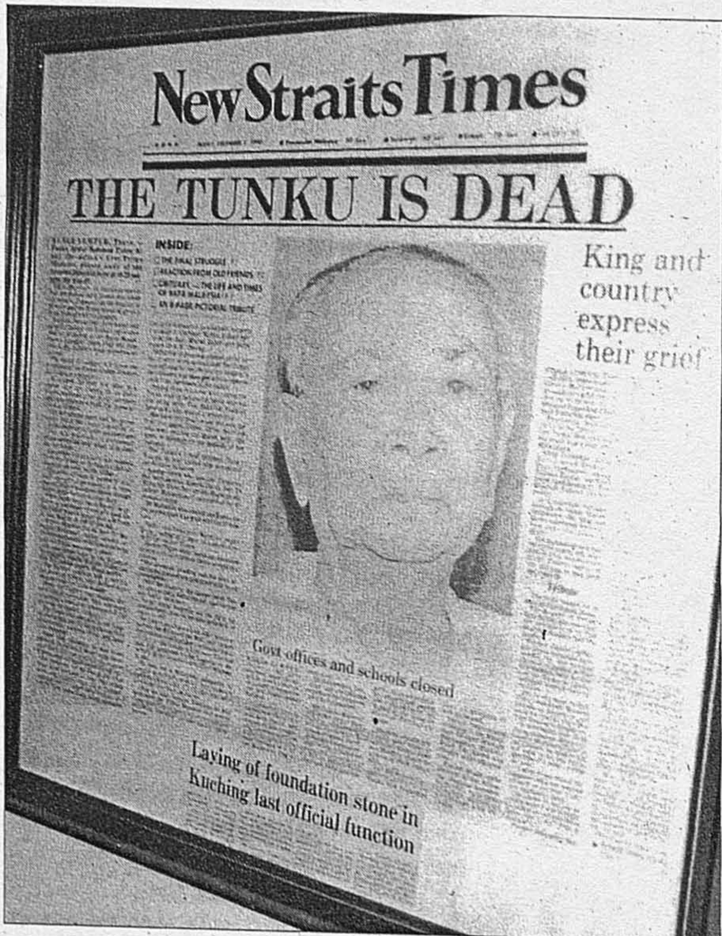
Keratan akhbar New Straits Times bertarikh 7 Disember 1990 menyiarkan di muka hadapan tentang kemangkatan Bapa Kemerdekaan itu

Tunku sebaliknya memilih Makam Di Raja di Lang