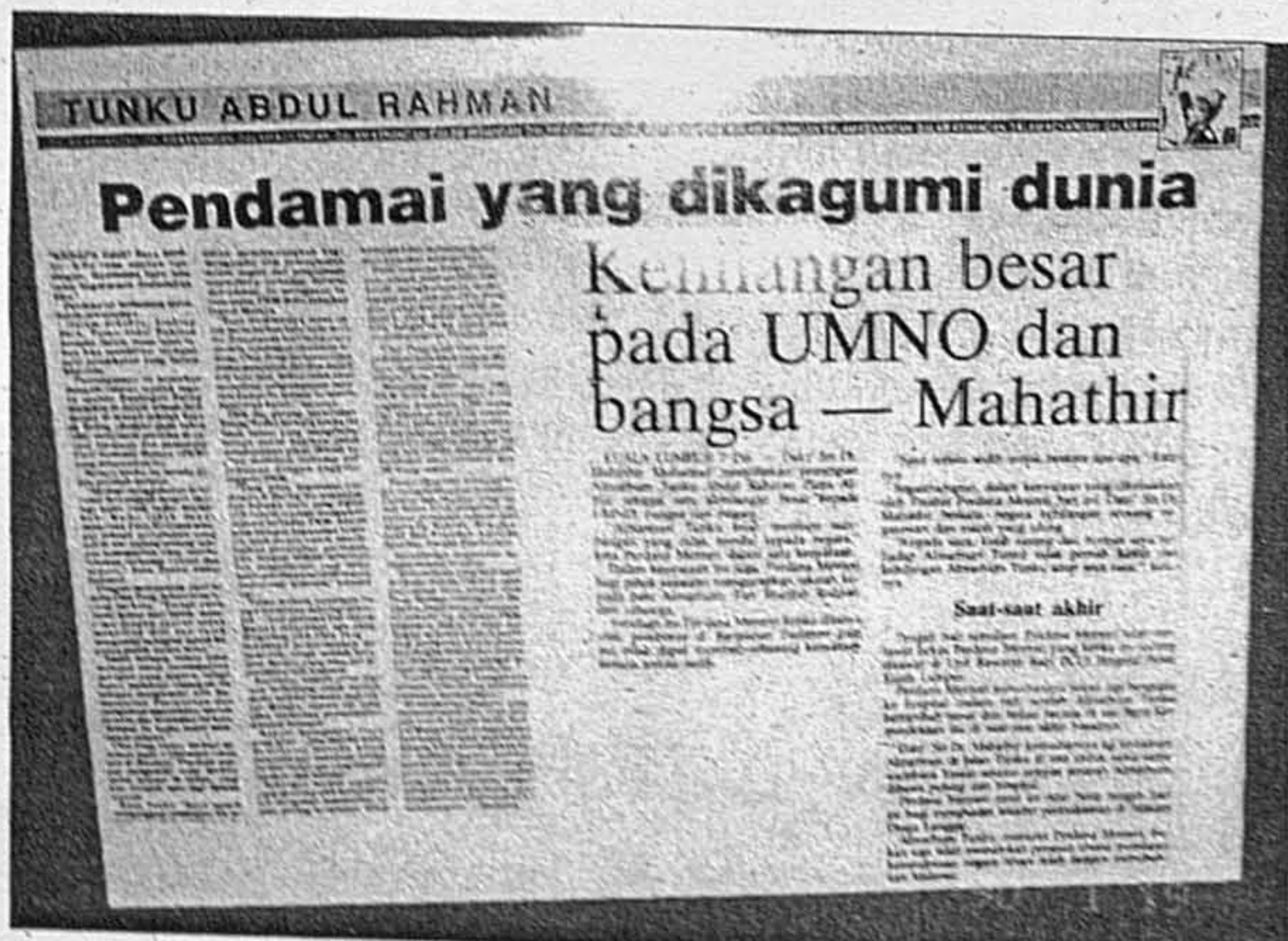
Antara keratan akhbar yang memaparkan tentang kemangkatan Tunku.