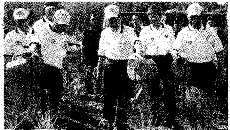
PERDANA Menteri Datuk Seri Abdullah Ahmad Badawi dan Muhyiddin Yassin serta pemimpin-pemimpin lain menyiram tanaman sebagai simbolik pelancaran kempen Bumi Hijau tahun lalu.

daun herba seperti daun kari dan kunyit sesuai dilaksanakan untuk kempen bumi hijau ini.