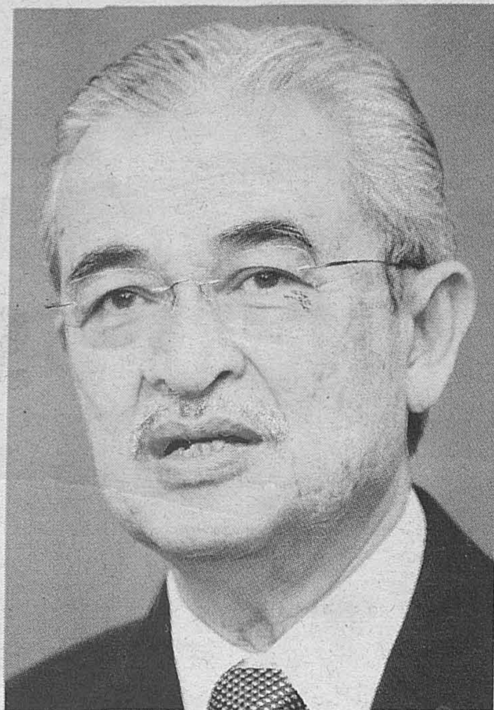
Abdullah Ahmad Badawi

Semalam, Mursyidul Am Pas, Datuk Nik Aziz Nik Mat, pula dilaporkan berkata beliau bersetuju jika muzakarah itu ditukar kepada muqabalah kerana baginya muzakarah lebih kepada perdebatan, manakala